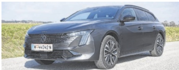
Der Peugeot 508 SW Allure BlueHDI 130 EAT8

Im Interieur erwartet den Fahrer die zwar schon gewohnte, aber immer noch extrovertierte Interpretation eines Cockpits. Eh klar ist hier die Rede vom kleinen Lenkrad samt darüber liegenden Anzeigen. Hat man sich erst einmal darauf und auf die etwas länger dauernde Suche nach der idea-