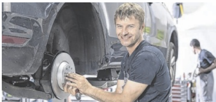
Bei Kneidinger gibt's Fixpreispakete für Reparaturen.

Insbesondere die Techniker nehmen jährlich an markenspezifischen Schulungen teil und sind somit wahre Experten für die Marken VW, Audi und Škoda. Gleichzeitig investiert Kneidinger in eine gute Werkstattausrüstung und Spezialwerkzeug. Mit diesen Voraussetzungen kann effizient und somit auch kostensparend gearbeitet werden. Kneidinger bietet daher für zahlreiche Reparaturen Fixpreispakete an.