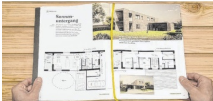
Stolz präsentiert m-haus das neue Handbuch auf der Messe in Wels

Die m-haus Hausdesigner präsentieren das druckfrische m-haus Handbuch: 37 perfekt durchdachte und mit viel Liebe zum Detail und zur Architektur entwickelte Entwürfe stehen für Holzliebhaber bereit. Auf über 160 Seiten zeigt das Waldinger Familienunternehmen, wie es seit Jahrzehnten architektonisch anspruchsvolle und ökologische