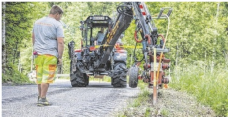
Die BBOÖ blickt zuversichtlich in die Zukunft des Glasfaser-Ausbaus.

100.000 Haushalte in ganz Oberösterreich haben durch die kontinuierlichen Bemühungen der BBOÖ bereits die Möglichkeit, sich an die Glasfaser-Infrastruktur