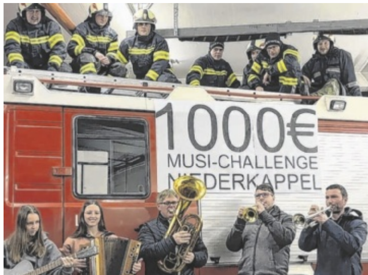
Musiker sind eingeladen, live auf der Bühne ihr Talent zu zeigen.

Musiktalente können sich am 26. April allein oder in der Gruppe (maximal 15 Personen) beim Burning Revolution dem Publikum präsentieren. Dieses belohnt den zehnmütigen Liveauftritt auf der Bühne mit hoffentlich viel Applaus, denn dieser wird gemessen und ist aus-