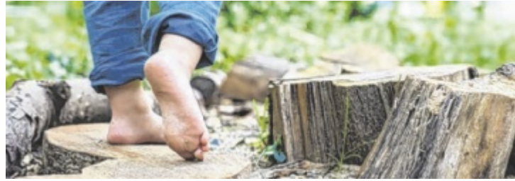
Schon von klein auf ist es wichtig, auf seine Füße zu achten.