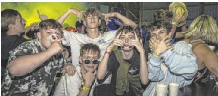
Im alten Gemäuer von Schloss Götzendorf steigt eine große Party.

Samstag, 9. März 19 Uhr Konzert Grenzwertig Schlosskirche Götzendorf www.ticketlotse.com/grenzwertig anschließend Party im Schloss www.ticketlotse.com/schlossrausch