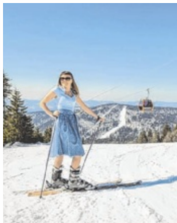
Trachten-Skitag: Dirndl- und Lederhosenfans aufgepasst!

Und wer noch nicht genug hat kann bei der Bierkisten-Slalom-Challenge zeigen, wie schnell er wirklich ist. Ganz gleich, ob jung oder alt, ob man sich mit Freun-