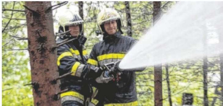
Tips sucht die beliebteste Feuerwehr Oberösterreichs.

OÖ. Sie sind immer zur Stelle, egal ob bei Bränden, Verkehrsunfällen oder Naturkatastrophen: Oberösterreichs Feuerwehren. Tips sucht gemeinsam mit dem ORF OÖ, dem Land OÖ, der Sparkasse OÖ und Zipfer im Rahmen des Sympathicus 2024 die beliebteste Feuerwehr.