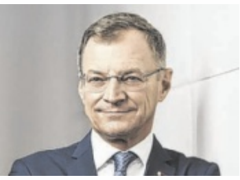
Oberösterreichs Landeshauptmann Thomas Stelzer

Einmal pro Tag kann auch auf www.tips.at gevotet werden. Dafür ist ebenfalls eine Registrierung mit Name und Mailadresse notwendig. „Das wird eine schwierige Wahl – denn sympathisch sind ja alle Feuerwehren in Oberösterreich. Sie sind das Rückgrat unserer Gesellschaft – herzlichen Dank für euren Ein-