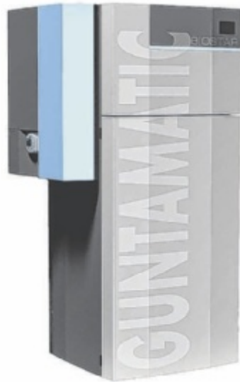
Neueste MildHybrid Pelletheizung von Guntamatic

Erspart man sich bei einer Umstellung von Öl oder Gas auf Pellets bereits bis zu über 35 Prozent an Heizkosten, so kann man mit den neuen „MildHybrid Pelletheizungen“ nochmals bis über 50 Prozent Heizkosten und Pelletverbrauch reduzieren. Das vollständig in den Kessel integrierte System wird von der Kesselregelung gesteuert. Je nach Auslegung werden so witterungsabhängig und intelligent tausende Liter PV-Wärme gespei-