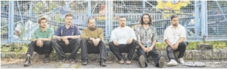
Takeshi's Cashew bringen psychedelischen Funk in den Club.