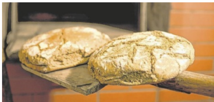
Brotbacken ist eine weitere Leidenschaft des Jungbauern.

Infos: www.hofroester.at sowie www.biohof-leimlehner.at ■