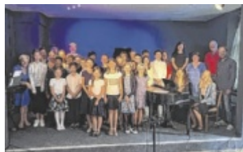
Die Schüler aus beiden Ländern musizierten zusammen.