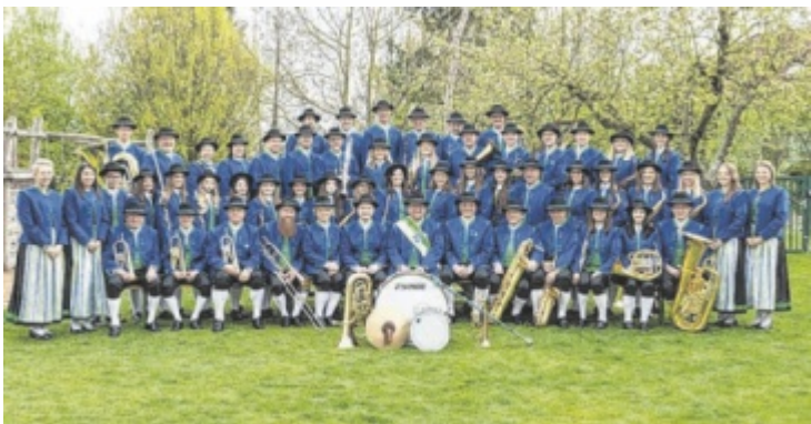
Der Trachtenmusikverein Mitterkirchen spielt am Sonntag auf.

14 Uhr mit Blasmusikklängen für Stimmung sorgt. Am 16. Juli darf man sich dann auf die Bürgerkorpskapelle Windhaag freuen. Jeden Freitag gibt es natürlich auch weiterhin die Unplugged-Abende am donAU-Stand'l, Beginn ist immer um 18 Uhr. ■