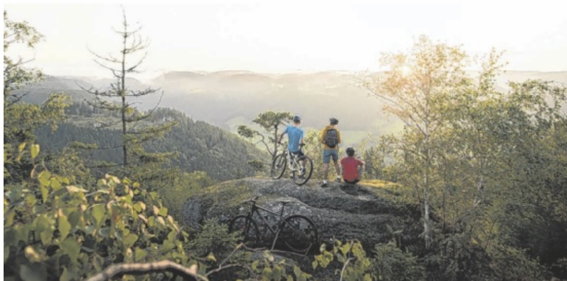
Mountainbiken im Mühlviertel bedeutet „Hügelbiken“, kaum einen Kilometer rollt man auf dem gleichen Terrain dahin. Der stete Wechsel hält die Biker auf Trab.

Die bestens beschilderte Mehrtages-Biketour führt über markante Hügel, durch erfrischende Flusstäler und langgezogene Wälder. Einzigartige Naturschutzgebiete wie das Tanner Moor, die Burgruinen Rutenstein und Prandegg sowie beeindruckende Granitfor-