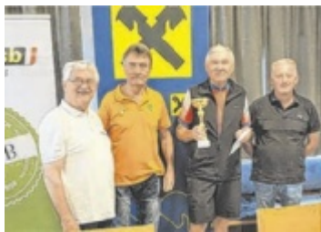
Begeisterte Sportler des Seniorenbandes Bezirk Perg.