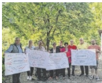
Die Freitagschule beschäftigte sich mit aktuellen, politischen Themen.