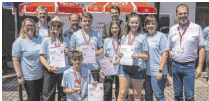
Die MS Pabneukirchen erreichte den zweiten Platz.

Junge Erste-Hilfe-Experten aus Schulen in ganz Österreich traten in inszenierten Notfallsituationen gegeneinander an. Insgesamt 150 Jugendliche im Alter von elf bis 19 Jahren nahmen am Wettbewerb teil. Sie haben bereits in Bezirks- und Landesbewerben überzeugt und sich damit für den Bundesbewerb qualifiziert. Die Schulteams zu je fünf Personen absolvierten beim Wettbewerb unter Aufsicht einer