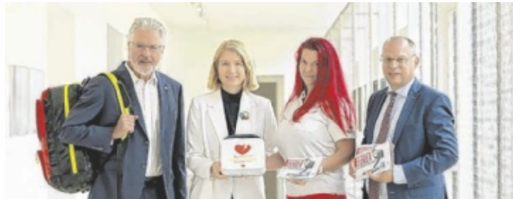
Oberösterreichweit gibt es in Gemeinden Aktionstage.

An einem Aktionstag können Bürger ihr Erste-Hilfe-Wissen auffrischen. Zudem soll die Hemmschwelle beim Bedienen von Laien-Defibrillatoren gesenkt werden. Ziel ist es, die Gemeindebevölkerung in einem unver-