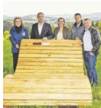
Die Liegen am Stoakraftweg laden zum Verweilen ein.

Die bewährte kostenlose App für Wanderbegeisterte bietet somit neben den wichtigen Informationen für die Wanderung auch noch Lehrreiches zu den Naturbesonderheiten am Weg. Nach Erreichen und Stempeln aller Stationen kann eine Urkunde generiert werden, die der Wanderer dann per E-Mail erhält. Etwa 50 Kilometer führt die abwechslungsreiche Tour durch die Naturparkgemeinden Bad Zell, Rechberg, St. Thomas am Bla-