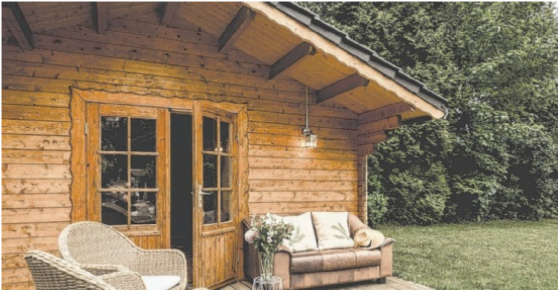
Eine gemütliche Gartenhütte hat ihren Charme.

Bei einer bebauten Fläche von 15 bis 35 Quadratmetern muss man im Bauland lediglich eine Bauanzeige einbringen. Mit