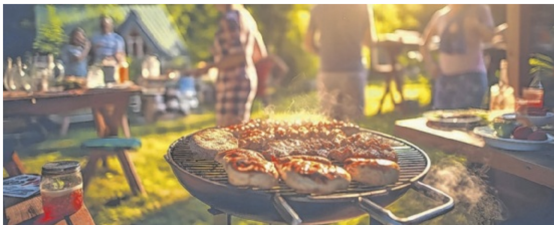
Mit der Familie oder der ganzen Verwandtschaft: Wird es zu eng, ist der Grillplatz ungemütlich.

Punkt eins: der Standort. Zu beachten gilt es den Sonnenstand während der Hauptsaison ebenso wie den Stand der Sonne zu verschiedenen Tageszeiten. Auch der Wind ist ein Thema, eine kalte Brise kann vor allem im Frühsommer das Grillen draußen unangenehm machen; andererseits ist es vielleicht genau die gleiche Brise, die im Hochsommer für Abkühlung sorgt. Man kann zum Probieren eine kleine Gartengarnitur auf den angedachten Platz