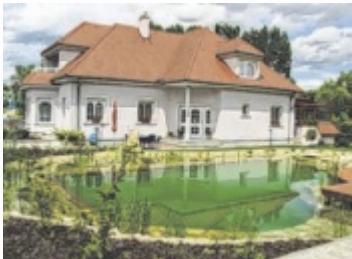
Privatanlagen belasten im Frühsommer den Wasserhaushalt vieler Gemeinden.

Ein kleiner Aufstellpool oder ein Planschbecken mit einem Durchmesser von etwa drei bis vier Metern und einer Tiefe von etwa einem Meter kann etwa 5.000 bis 10.000 Liter Wasser fassen. Ein durchschnittlicher Privatpool mit den Abmessungen acht mal vier Meter und einer Tiefe von 1,5 Metern kann etwa 40.000 bis 50.000