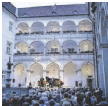
Im Landhaus-Arkadenhof warten wieder der Sommerklänge.