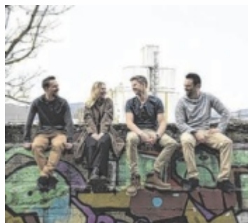
Queen'z Garden aus Linz spielen Funk, Soul und R&B.

Heuer treten erstmals auch junge Talente der Landesmusikschule auf und eröffnen den musikalischen Abend im Park. Anschließend spielen „Queen'z Garden“ aus Linz eine Mischung aus Funk, Soul und R&B. Die junge Band wurde vor zwei Jahren gegründet und will mit ihrer Musik positive Stimmung verbreiten. Sie covert Songs aus 50 Jahren Musikgeschichte bis hin zu top-aktuellen Klassikern. Zwischendurch wird das Programm durch einige