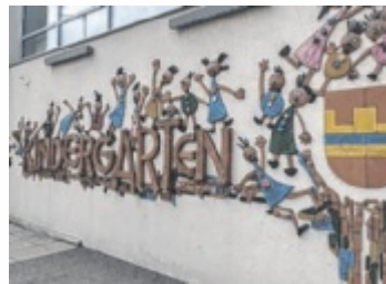
Derzeit betreibt die Gemeinde Kindergarten und Krabbelstube selbst. (geri)

„Unser großes Anliegen ist es, die hohe Qualität und die ausgedehnten Öffnungszeiten weiter gewährleisten zu können. Deswegen wurde es für sinnvoll erachtet, einen Träger zu suchen,