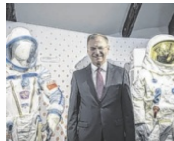
Landeshauptmann Thomas Stelzer machte sich selbst ein Bild vom Angebot der communale.

PEUERBACH. Die communale oö, das neue Kulturformat des Landes OÖ, hat ihre Türen geöffnet und bietet noch bis 26. Oktober ein breitgefächertes Kulturprogramm. Anlass für die communale in Peuerbach gibt der 600. Geburtstag des Astronomen Georg von Peuerbach. Das Programm unter dem Motto „Kosmos. Neue Welten“ wird Ausstellungen, Kunstprojekte, Performances, Diskussionsrunden und Symposien umfassen. Tips verlost 8x2 communale Pässe für den Zutritt zu den Veranstaltungen im Rahmen der communale. ■