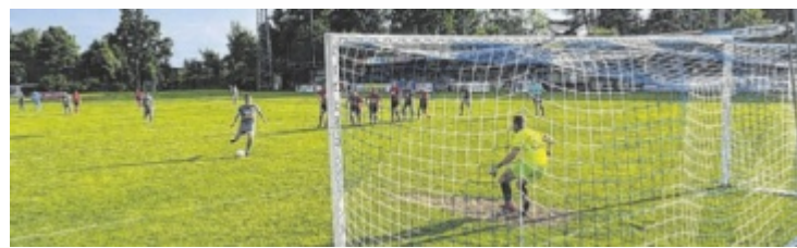
Das einzige Tor für die SPG traf Christian Haslhofer durch einen Elfmeter.

LIGA PORTAL REINKLICKEN IST WIE MITKLICKEN