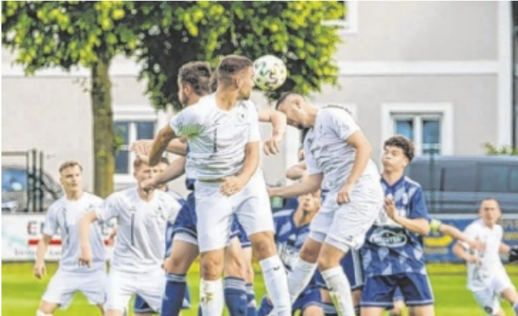
Die Naarner Mannschaft zeigte Kampfgeist bis in die letzte Runde, der am Samstag mit dem erhofften Meistertitel belohnt wurde.

Nach dem Auswärtssieg bei Doppl-Hart war für die Union Ried in der Riedmark alles für den endgültigen Ligaverbleib angeordnet. Doch ausgerechnet im letzten Spiel in Ried war man der Aufgabe nicht gewachsen.