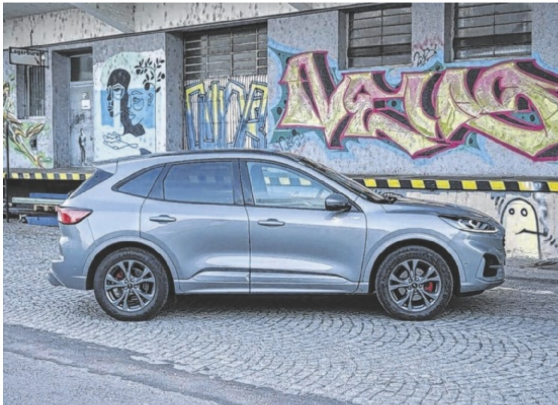
Der Ford Kuga FHEV AWD Graphit Tech Edition ist ab 53.550 Euro zu haben.

Der Kuga Vollhybrid lädt seine Batterie ausschließlich während der Fahrt auf, entweder beim Ausrollen oder beim Bremsen. Gesammelt in einem Akku mit einer Kapazität von 1,1 kWh reicht das für reichlich elektrische Unterstützung und kurze rein elektrisch zurückgelegte Strecken. Klingt nicht zwingend nach der ersten Wahl für lange Autobahnetappen. Tatsächlich ist vor allem innerstädtisch der Verbrauch überragend, der ruhi-