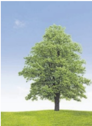
Ein Ahornbaum

Der Feldahorn ist ein heimischer Baum, der für seine Trockenheitstoleranz bekannt ist. Er kann in verschiedenen Bodentypen wachsen und ist relativ anspruchslos. Die Schwarzkiefer ist eine robuste Baumart, die in trockenen Gebieten gut gedeiht. Sie ist in den österreichischen Alpen verbreitet und kann auch auf trockenen Böden gedeihen. Die Flaumeiche ist eine weitere Eichenart, die als trockenheitsresistent gilt. Sie kann auch auf kargen und trockenen Böden überleben und ist in einigen Teilen Österreichs anzutreffen. Es ist wichtig zu beachten, dass selbst trockenheitsresistente