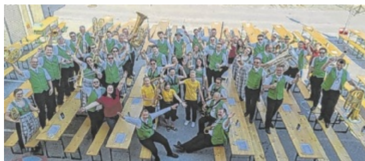
Die Blasmusiker der Stadtkapelle brachten Perg zum Klingen.

Orchester“ konnten sie bei der „Fuchsgrabenpolka“ und dem Marsch „Mein Heimatland“ ihr Können unter Beweis stellen. Die Stadtkapelle Perg ist am Sonntag, 18. Juni, das nächste Mal zu hören: beim Radio OÖ Frühschoppen im Gasthaus Aumühle in Grein. Der Frühschoppen beginnt um 10 Uhr und wird ab 11.04 im Radio OÖ landesweit übertragen. Besucher willkommen, Eintritt frei. ■