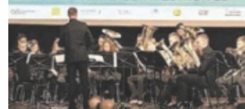
Ausgezeichnet werden die Gewinner im Rahmen einer Preisverleihung.

line-Voting kann auch für den Tips-Publikumspreis abgestimmt werden. Zahlreiche Preise warten. ■