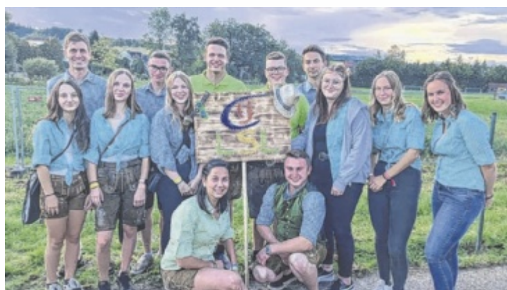
Die Landjugend LSL freut sich auf zahlreiche Gäste bei ihrem Jubiläumsfest am Samstag, 17. Juni, in Luftenberg.

Im Vorverkauf kosten die Karten 18 Euro, an der Abendkasse 20 Euro. Weitere Infos zur Veranstaltung unter www.kuk-mauthausen.at ■