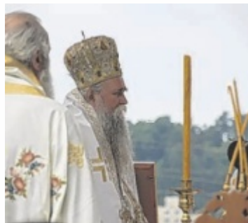
Oberster Vertreter Patrijarh Porfirije

Bereits im 1. Weltkrieg – lange vor dem schrecklichen NS-Konzentrationslager – gab es in Mauthausen ein Lager für Kriegsgefangene. Vor allem Serben, Russen und Italiener waren hier inhaftiert gewesen. Tausende von ihnen starben im Zuge