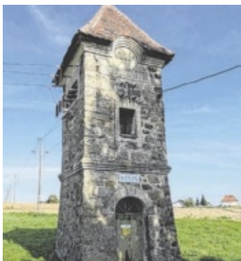
Der Rieder Trafo aus dem Jahr 1922 steht unter Denkmalschutz.