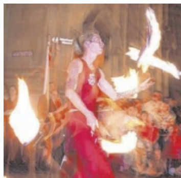
Die „Mindspinners“ bieten um 21.45 Uhr eine feurige Show.

Ab 15 Uhr bespielen mehrere Ensembles und Bands aus der Region die Bühne vor dem Rathaus. Um 19 Uhr eröffnet Bürgermeister Toni Froschauer dann offiziell das Fest. An zahlreichen Ständen bieten die Vereine ein Unterhaltungsprogramm für Groß und Klein. Rund um die Bühne sorgen mehrere Wirte für das leibliche Wohl der Gäste. Als besonderes Highlight gibt es um 21.45 Uhr eine Feuershow der „Mindspinners“.