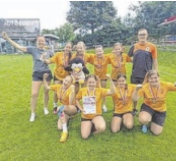
U14-Mädels holten sich den Vizelandesmeistertitel.

MÜNZBACH. Anders als bei der vergangenen Hallen-Landesmeisterschaft konnten die Schützlinge des Betreuer-teams Schartmüller/Gruber diesmal die hohen Erwartungen mehr als erfüllen.