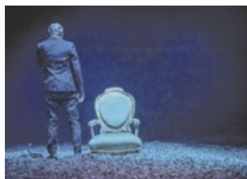
Premiere am 14. Juli