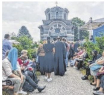
Zustrom zur Kapelle

einer Fleckfieber-Epidemie im Jahr 1915, darunter bis zu 8.000 serbische Gefangene. Mit Spenden gläubiger Serben aus ganz Österreich wurde nun eine Gedenkkapelle auf dem Gelände des Soldatenfriedhofs errichtet, die am Samstag von den höchsten Würdenträgern der ser-