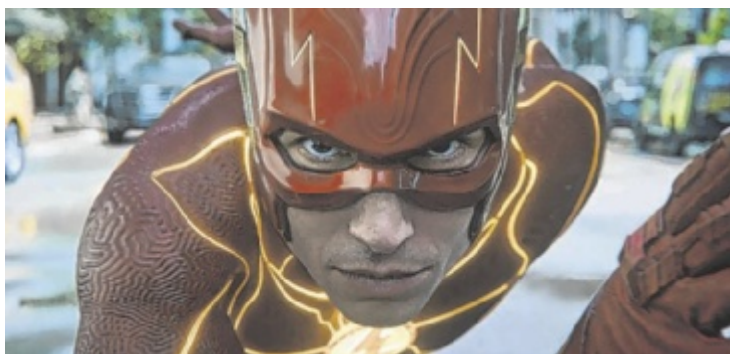
Die Comicfigur „The Flash“ ist Vorlage für den Film-Superhelden.