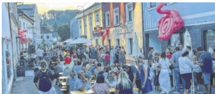
Die Einkaufsnacht belebt die Straßen von Schwertberg.