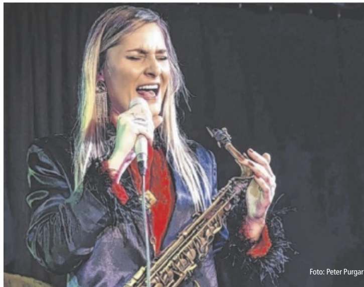
Die Saxophonistin gilt als Multitalent – sie spielt ihr Instrument und singt.