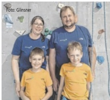
Die junge Familie lebt für ihren Sport.