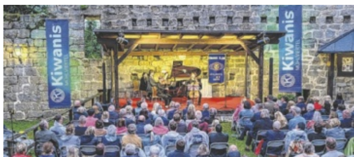
Das Sommernachtskonzert war ein voller Erfolg.