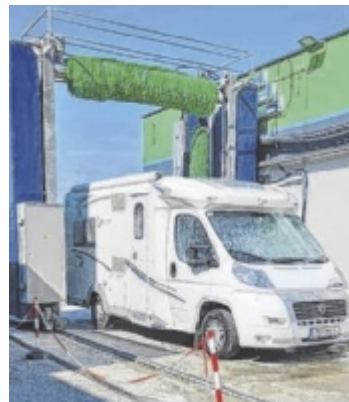
Regelmäßige Reinigung und Pflege erhöhen die Lebensdauer des Reisemobils.

Einfach vorbeikommen, anrufen oder die Mitarbeiter der StarWash per E-Mail/WhatsApp kontaktieren, um einen Termin für die WOMO-Wäsche zu vereinbaren. Gerne kann man vorab besprechen, welche Möglichkeiten es gibt, um eine perfekte Lösung für das Reisemobil anzubieten. Gerade bei Wohnmobilen und Wohnwagen sind die Reinigung und Pflege besonders wichtig, um die Lebensdauer dieser Fahrzeuge so lange wie möglich zu erhalten.