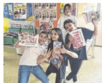
Mangas liegen im Trend.

MAUTHAUSEN. Die Eröffnung der MANGA-Abteilung in der öffentlichen Bibliothek Mauthausen wird mit einem Sommer-Gewinnspiel gefeiert. Es gibt bereits 400 Bände zu entleihen. Bis 7. September können Kinder bis 16 Jahre pro ausgeliehenen Manga einen Stempel im Sammelpass sammeln. Ab fünf Stempeln nimmt man an der Verlosung teil und kann tolle Preise gewinnen. ■