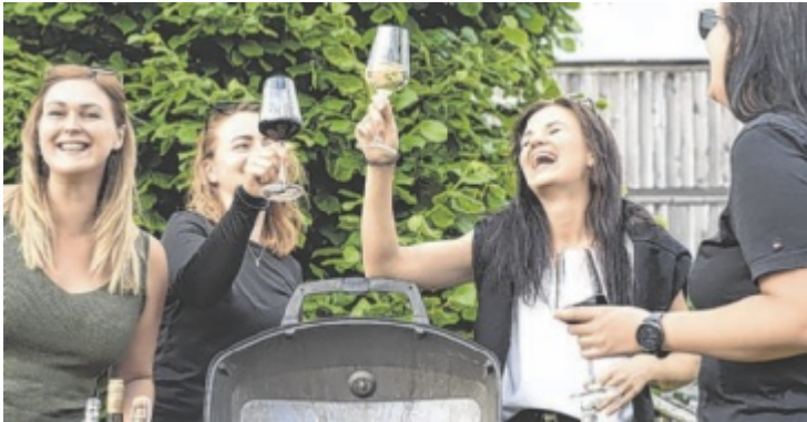
Hauptgewinn ist ein Napoleon Griller im Wert von 1.000 Euro.

Insgesamt werden die besten Weine von 13 Winzern zu verkosten sein. Zehn davon stellen ihre Produkte persönlich vor. Aus Niederösterreich gibt es Weine von den Weingütern Eminger, Schauerhuber, Diwald, Diry, Nebenführ, Karner, Hausdorf, Engelbrecht, Kolkmann und Schwinner. Wein aus dem Burgenland präsentiert das Weingut Strass. Oberösterreich wird durch