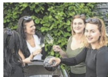
Weingenuss Am kommenden Samstag findet auf der Aiserbühne ein Weinfest mit 13 Winzern statt. Seite 36/ Foto: Ströbitzer

Die Gemeinde Luftenberg ist derzeit auf der Suche nach einem neuen Träger für ihren achtgruppigen Kindergarten. >> Seite 11