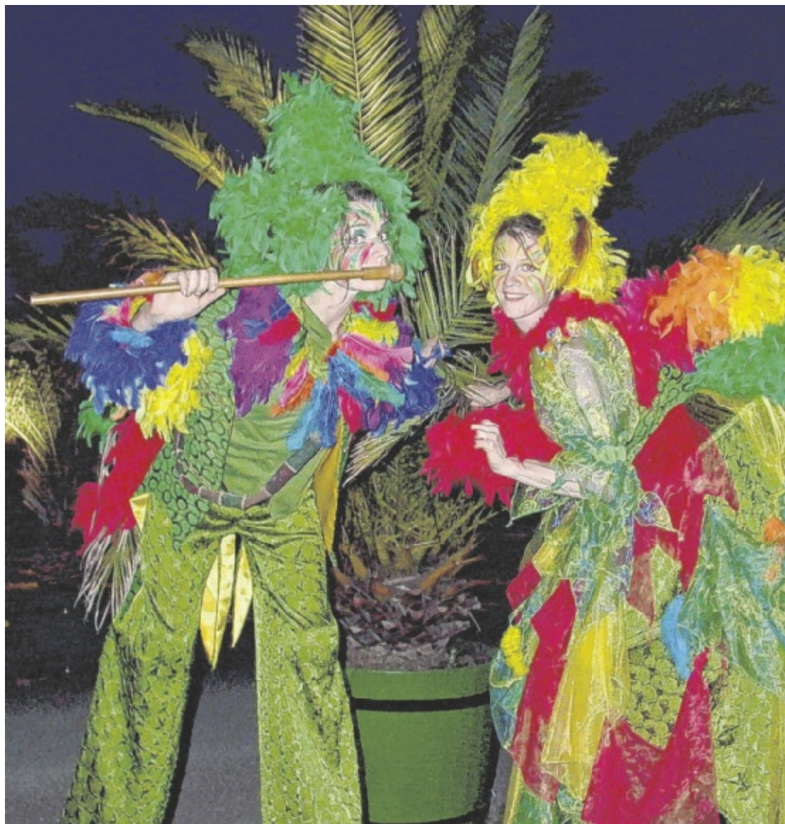
Spaß und Action am Hauptplatz Am Samstag, 17. Juni, steigt in Perg wieder das beliebte Einhornfest. Künstler, Vereine und Gastronomen bieten ein buntes Programm für Groß und Klein. Seite 37