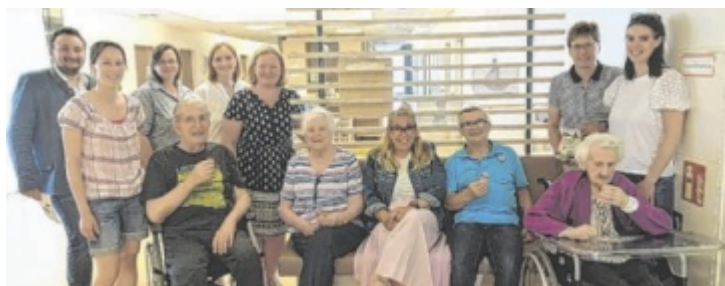
Die Bewohner freuten sich über das mitgebrachte Erdbeereis.

steilste Laufsteg bei Sport Mayr, der höchste am Marktplatz und der längste (50 Meter) auf der Hauptstraße zu finden sein. Moderiert wird die Veranstaltung von Mario Sacher. Wie bei jeder Einkaufsnacht gibt es auch heuer wieder kulinarische Köstlichkeiten und Aktionen. Weitere Infos unter: www.4311.at ■