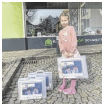
Die MINT-Koffer kann man sich in der Bibliothek ausborgen.

Beim „MINT-Koffer“ handelt sich um eine mobile Experimentierstation zu Mathematik, Informatik, Naturwissenschaften und Technik für zu Hause. In der Bibliothek Schwertberg können sich alle Kinder einen MINT-Koffer ausleihen und mit den darin enthaltenen Inhalten selbstständig zu Hause forschen, experimentieren und tüfteln. Damit der Zugang allen Kindern offensteht, ist die Ausleihe der MINT-Koffer für die erste Woche gratis! Im Koffer ist neben