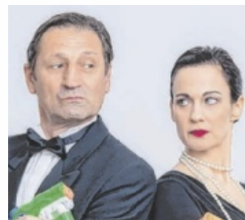
Das Publikum darf sich auf eine witziges Stück freuen.