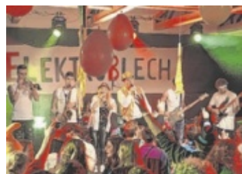
Zeltfestfieber Am kommenden Wochenende findet wieder das traditionelle Zeltfest in Naarn statt. Seite 37 / Foto: Elektroblech

Die Besucher des Perger Kulturhofs dürfen sich heuer erstmals auf ein Singspiel freuen. Auch eine neue Tribüne kommt. >> Seite 35