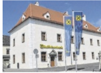
Auch die Raiba-Bankstelle in Windhaag ist betroffen.