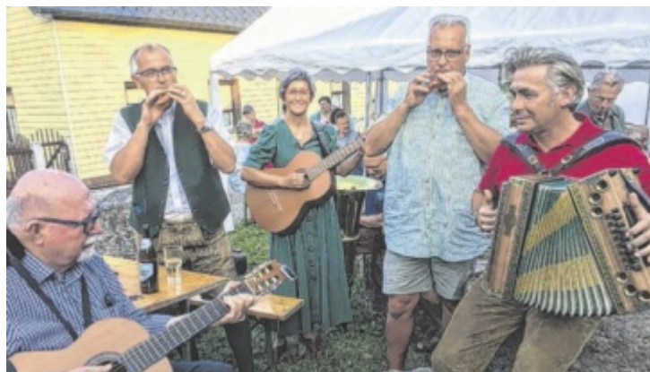
Gemeinsam musizieren lautet das Motto an den drei Abenden.

„Einfach kommen und mitspielen/mitsingen“ lautet das Motto bei den drei Volksmusikabenden im Steinbrecherhaus. Diese finden jeweils donnerstags am 22. Juni, 6. Juli und am 20. Juli statt. Beginn ist jeweils um 19 Uhr bei