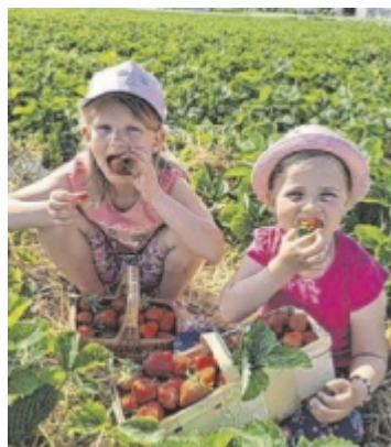
Erdbeertraum Diesmal dreht sich in unserer Kategorie Regional versorgt alles um die süßen, roten Früchte. Seiten 18, 19