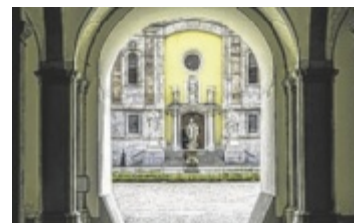
Stift Seitenstetten ist Ziel des Ausflugs der KFB.

PERG. Am 14. Juni findet der Frauenausflug der Katholischen Frauenbewegung statt, bei dem das Benediktinerstift Seitenstetten und der Hofgarten besichtigt werden. Außerdem wird in der Kirche St. Michael am Bruckbach die Messe mit Pfarrer Hörmanseder gefeiert. Abfahrt ist um 7.45 Uhr vor der Kirche, 8 Uhr am Hallenbadparkplatz. Geschätzte Ankunft in Perg um 15 Uhr. Anmeldung bis 9. Juni unter 0664 88583160 oder im Pfarrbüro Perg. ■