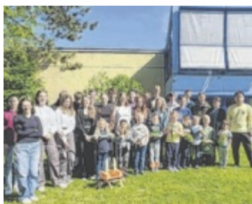
Die Kleinen und die Großen hatten viel Freude mit dem Besuch.