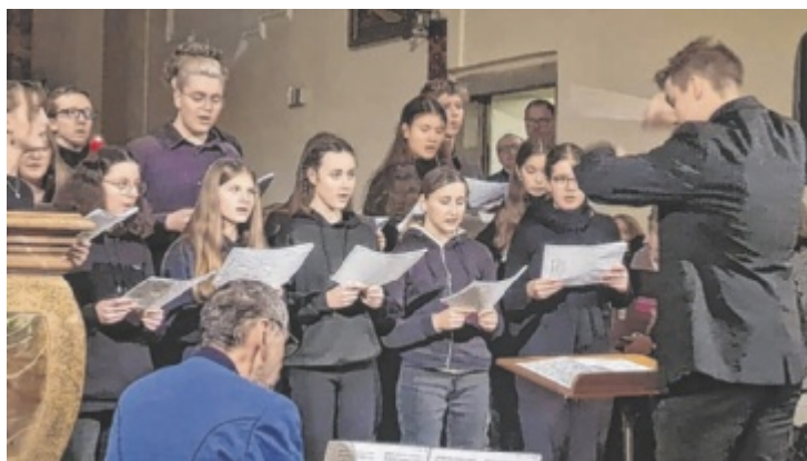
Der Jugendchor Naarn freut sich auf viele Zuhörer.

LUFTENBERG. Die Grünen holen die New Ohr Linz-Dixieland Band für eine Jazz-Matinee nach Luftenberg. Am Samstag, 17. Juni, sorgt das Trio ab 11 Uhr im Gastgarten des Lehenhofs in Abwinden für Stimmung. Der Eintritt ist frei. ■