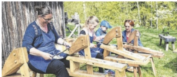
Die Besucher können alte Handwerkstechniken kennenlernen.