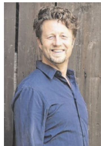
Tenor Raimund Stangl

Perg: Heimathaus-Stadtmuseum, jeden Samstag und Sonntag von 14.00 - 17.00 und nach telefonischer Vereinbarung, ☎ 0650 5427786 oder ☎ 0664 2159788