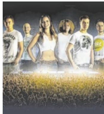
Die junge Band XDREAM heizt den Gästen am Samstag ein.