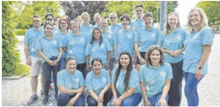
Die Schüler der ABS sind essenziell für die regionale Pflegelandschaft.

Es ist ein großer Schritt in eine regionale soziale Sicherheit, zu dem die Schüler mit ihrer Ausbildung beitragen. Der Sozialhilfverband (SHV) Perg als größter regionaler Arbeitgeber in der Pflege und als Auftraggeber für fast alle sozialen Dienstleistungen im Bezirk Perg (alle mobilen Pflege- und Betreuungsangebote, Demenz- und Sozialberatungsstellen, Senioren-Tagesbetreuung) unterstützt sie und hofft, sie so auch langfristig für die Pflege zu gewinnen. Bezirkshauptmann und Obmann des