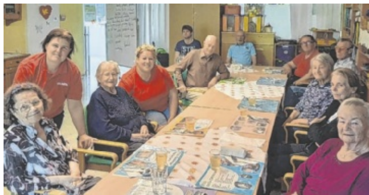
In der professionell-familiären Atmosphäre des Tageszentrums wird das Motto „A Mensch möcht i bleib'n“ gelebt.