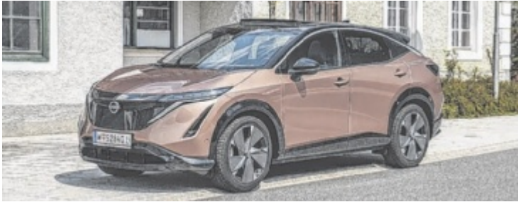
Der Nissan Ariya Evolve Pack 87 kWh ist ab 67.500 Euro erhältlich.

Mit dem Namen Ariya hat man uns Mitteleuropäern keinen Gefallen getan. Kleiner Tipp: Das „y“ stumm lassen. Das war es dann aber auch schon mit notwendiger Hilfe zur Selbsthilfe. Heißt aber nicht, dass der Ariya auf weitere unkonventionelle Ideen verzichtet. So ist die Mittelkonsole elektrisch zu verstellen, auch das unter dem Armaturenräger gelegene Ablagefach ist elektrisch zu öffnen. Ein stimmiger Ansatz für ein Elektroauto, auf jeden Fall aber verhaltensoriginell und einzigartig. Der größere der beiden angebotenen Akkus ist 87 kWh stark,