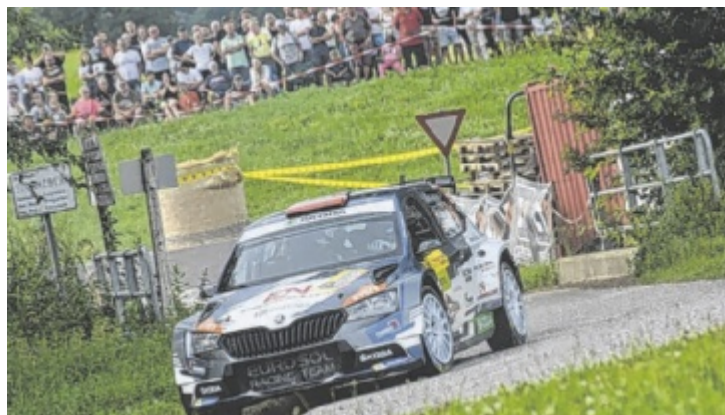
Am 12. August startet Rennen um begehrte Mühlstein-Trophäe.

Die Vorbereitungen des Rallye Club Perg laufen bereits auf Hochtouren für das beliebte PS-Spektakel in der Region. Mit neuen Strecken und Actionzonen, die auch rund um Grein führen, können die Zuschauer heuer insgesamt rund 93 Sonder-