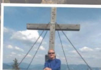
Thomas aus Freistadt Hochanger, 1304 m

Wir wünschen allen Teilnehmern eine erfolgreiche Wandersaison!