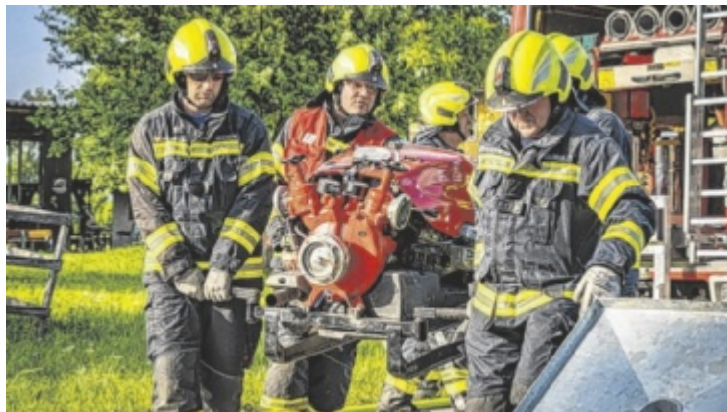
Elf Feuerwehren stellten ihr Können bei der Übung unter Beweis.

Um 18 Uhr wurde der Alarm ausgelöst und die Feuerwehren rückten zur Einsatzstelle aus. Dort mussten sie von einer Explosion und einem Brand in einer Lackierwerkstätte sowie acht vermissten Personen ausgehen. Ziel dieser Übung war es, die Zusammenarbeit zwischen den verschiedenen Feuerwehreinheiten und dem Roten Kreuz zu testen. Neben den Feuerwehren Mauthausen und Haid nahmen auch die Florianis aus Au an der Donau, Aisting-Furth, Blindendorf,