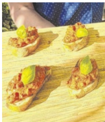
Vegetarischer Vorspeisenhit: mediterrane Saganaki-Brote

Wir freuen uns über Rezepte (gerne auch mit Fotos), die dann online oder auch in der Zeitung veröffentlicht werden, per E-Mail an: grillen@tips.at