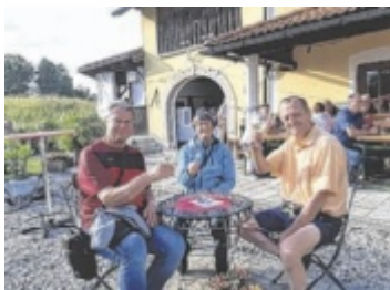
Das Weinfest in Allerheiligen ist schon Tradition.

ALLERHEILIGEN. Die SPÖ Allerheiligen veranstaltet am Samstag, 10. Juni, ihr traditionelles Weinfest. Ab 17 Uhr werden ausgesuchte Weine aus NÖ, der Steiermark und dem Burgenland ausgeschenkt. Bis 20 Uhr gibt es Kinderbetreuung mit Hüpfburg und Spielbus der Kinderfreunde. Innerhalb des Gemeindegebiets von Allerheiligen wird ein Heimbringerdienst angeboten. ■