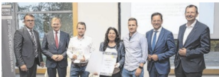
Die Fußballschule OÖ freute sich 2021 über einen Hauptpreis.