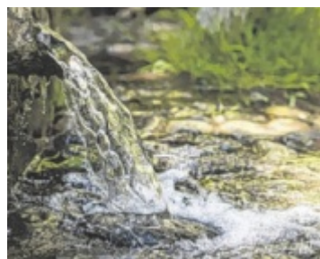
Seit 110 Jahren wird in Sarmingstein Wasserkraft genutzt.

Ansetzen will man hier etwa beim schulischen Kochunterricht, für dessen Ausweitung sich Ecker und Binder aussprachen. Auch die Eltern nahmen die FP-Politikerinnen in Sachen Bewusstseinsarbeit in die Pflicht. ■