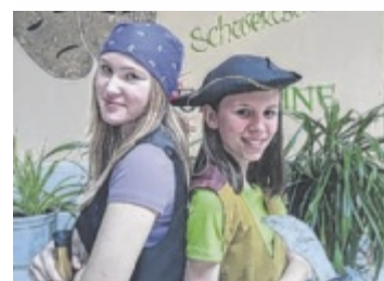
Die Kinder spielen zugunsten des Vereins Herzkinder.