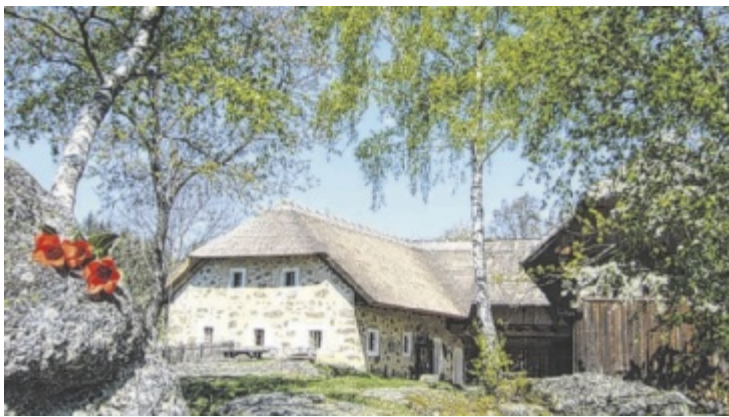
Am Großdöllnerhof warten am 11. Juni zahlreiche kulinarische Schmankerl auf die Gäste. Der Schmankerltag findet bei jedem Wetter statt.