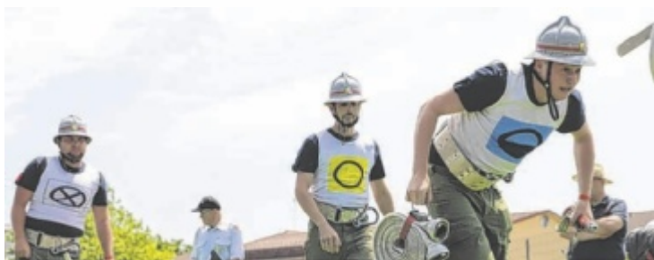
Die Gruppen liefern zur Höchstform auf.