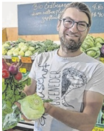
Auch das Frühgemüse ist bereits reif.