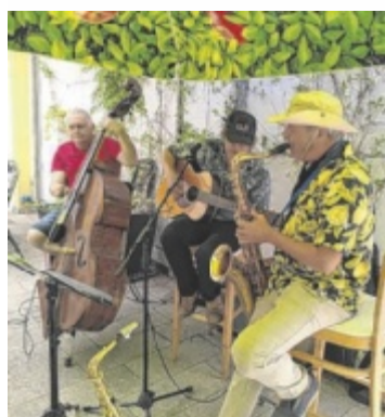
Die dreiköpfige New Ohr Linz-Dixieland Band ist eine lokale Größe in der Jazz-Szene.

Der Jugendchor Naarn probt wöchentlich samstags. Wer Interesse daran hat mitzusingen, kann sich per E-Mail an jcnaarn@gmail.com wenden. Weitere Infos gibt es unter www.jugendchor-naarn.webador.at ■