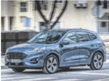
Der Ford Kuga Plug-in-Hybrid ist europaweiter Verkaufsschlager.

Der Ford Kuga wird in zwei Varianten angeboten: als herkömmlicher Verbrenner oder als Plug-in-Hybrid. Der 2,5-Liter-Duratec-Motor des Kuga PHEV entwickelt eine Systemleistung von 165 kW (225 PS). Darüber hinaus bietet der Kuga Plug-in-