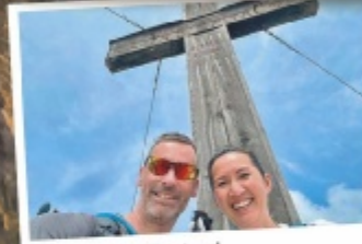
Wolfgang aus Linz Land Bosruck, 1992m