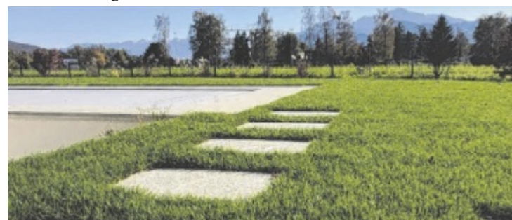
Hennerbichler sorgt für saftig, grünen Rasen im Garten.

Tel.: 0664 9220222 info@hennerbichler-gartenbau.com