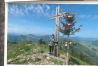
Johanna aus Eferding Faistenauer Schafberg, 1559 m