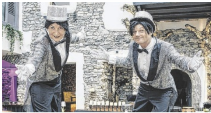
Das Kleinkunstduo Teatro Banal verblüfft die Besucher auf Stelzen.