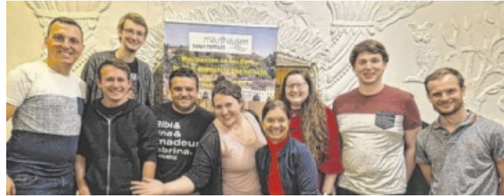
Die stolzen Sieger der vergangenen Ausgabe des Pub Quiz