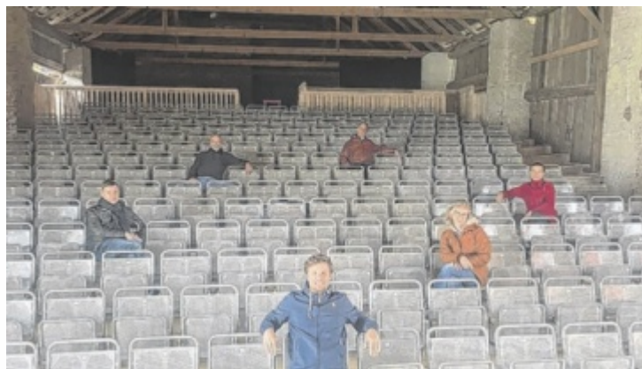
Die Tribüne steht, das Ensemble testet schon die neue Bühnenansicht.