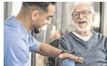
Pflegekräfte werden händeringend gesucht.