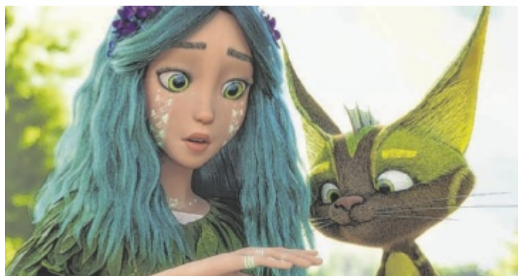
Die zierliche Mavka soll die magische Lebensquelle schützen.