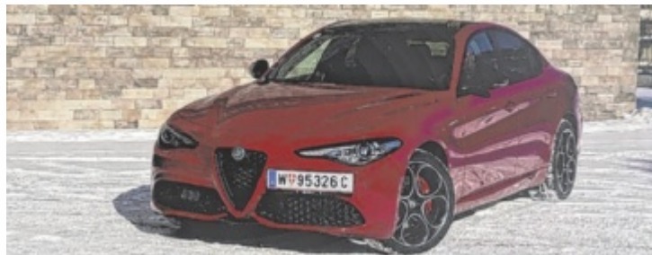
Der Alfa Romeo Giulia 2.0 16V 280 AT8 Q4 ist ab 68.000 Euro erhältlich.

Ähnlich erfreulich auch das Interieur. Große Schaltwippen, Dekorleisten aus Aluminium und Sport-Ledersitze setzen hier optische Akzente in einem ordentlich eingerichteten Innenleben. Und, falls hier noch alte Vorurtei-