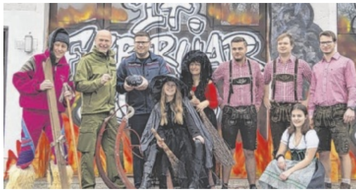
Die Feuerwehr Blindendorf macht im alten Haus nochmal Party.