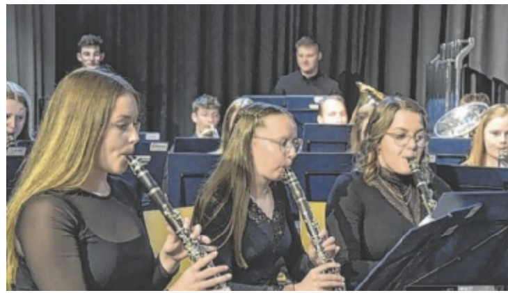
Das Bezirksjugendorchester Perg konzertiert wieder.