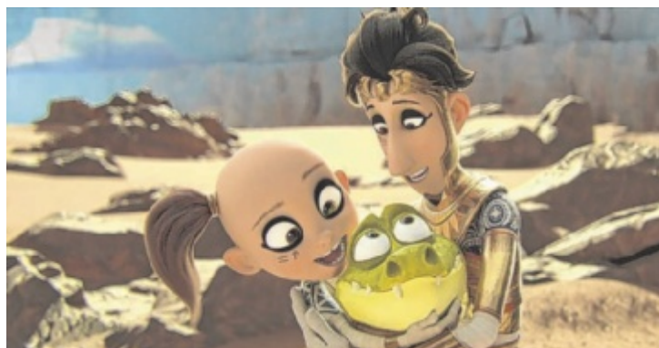
Drei Mumien kommen in die Welt der Lebenden.

4320 Perg, Johann-Paur-Straße 1, Mo bis Do: 14 bis 17 Uhr Tel: 0664 6007215917 jugendservice-perg@ooe.gv.at www.jugendservice.at