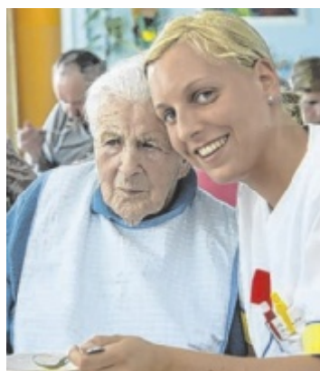
Pflegefachkraft – ein Beruf der Sinn stiftet.

Das Berufsbild Fach-Sozialbetreuer/in Altenarbeit beinhaltet die Ausbildung zur Pflegeassistenz, ist auf Anliegen von betreuungs- und pflegebedürftigen alten Menschen abgestimmt und zielt im 2. Modul „Sozialbetreuung“ auf die Förderung des selbstbestimmten und eigenständigen Lebens älterer Menschen ab. Heimhelfer/innen unterstützen Menschen im Alter bei der Haushaltsführung und den Aktivitäten des täglichen Lebens im Sinne der Selbstständigkeit bzw. Hilfe zur Selbsthilfe. Näheres zu