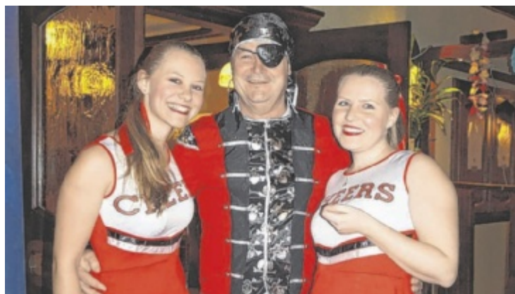
Beim Musiker-Maskenball wird es bestimmt wieder ganz besonders lustig.

PERG/AISTHOFEN. Am Bauernmarkt in Aisthofen wird auch Fasching gefeiert. Am Samstag, 18. Februar, gibt es neben den üblichen Schmanckern auch ein Fest. Zu Gast ist auch die Jonglierkünstlerin „Jonglina“. Der Bauernmarkt Aisthofen in der Bauernmarkthalle hat jeden Samstag von 7.30 bis 11 Uhr geöffnet.