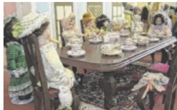
Kätes Puppenwelt

PERG. Nach fast 20 Jahren verlässt Kätes Puppenwelt das Heimathaus-Stadtmuseum Perg. Die von Käte und Erwin Kranzler liebevoll hergestellten Puppen-Ensembles waren ein beliebter Teil der Dauer-ausstellung des Museums.