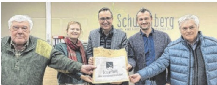
Sozialer Schulterschluss aller Parteien im Gemeinderat.

zung mit einem einstimmigen Beschluss. Anspruchsberechtigt sind Ein-Personen-Haushalte mit einem Einkommen bis 1.350 Euro sowie Zwei- und Mehrpersonen-Haushalte, denen maximal 1.800 Euro im Monat zur Verfügung stehen. Bewilligten Heizkostenzuschussbeziehern wird die Förderung automatisch und unbürokratisch überwiesen. Alle anderen haben die Möglichkeit, nach Ostern in der Bürgerservicestelle anzusuchen. ■