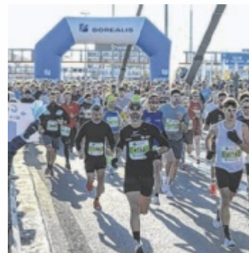
In Bewegung bleiben lautet das Motto beim heurigen Linz Donau Marathon im April.

Mit all seinen Bewerben ist der Linz Marathon seit Jahren die größte Breitensport-Veranstaltung des Landes. Trotz der zuletzt erfolgreich verbesserten Streckenrekorde stehen bei diesem Festival der Bewegungsfreude nicht nur die Klasse-Athleten im Mittelpunkt, sondern vor allem die vielen Siegertypen in der Masse des Starterfeldes. Die Freude über persönliche Erfolgserlebnisse steht vielen Läufern auf den letzten Metern ins Gesicht geschrieben. Auch für