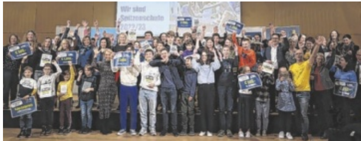
Alle Preisträger der Spitzenschulen mit den Gratulanten

31 Projekte wurden eingereicht, 27.868 Stimmen entschieden darüber, wer am Ende das Rennen machte. Der Sieg in der Kategorie „Bewegung in der Schule“ ging an die HTL Braunau mit dem Projekt „Mein Baum steht in Uganda!“ vor der VS Punzerstraße in Steyr mit „So ein Zirkus“. Als stimmenstärkste Volksschule dürfen sich die Schüler zudem über den Spezialpreis freuen: eine exklusive Kinovorstellung bei Star Movie inklusive Backstageführung und Popcorn. Platz drei