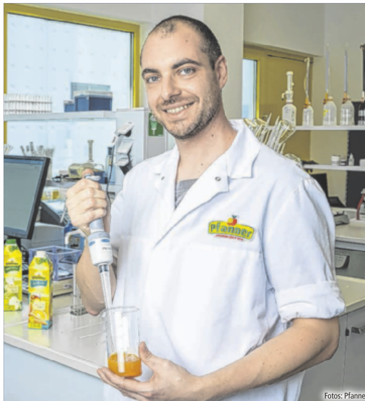
Die Qualitätskontrolle: wichtiger Teil der Fruchtsaftproduktion

Modernste Infrastruktur mit einem hohen Automatisierungsgrad erleichtern in den Pfanner Laboren die Arbeit und ermöglichen Untersuchungen, zum Beispiel auf Pestizide, die in einem Familienbetrieb in dieser Branche kaum zu finden sind. Auf neue Mitarbeiter wartet ein aktives, dynamisches, offenes, verantwortungsbewusstes Team unterschiedlichen Alters, die das gemeinsame Ziel eint: die gewohnt hohe Produktqualität kontinuierlich aufrechtzuerhalten, ohne