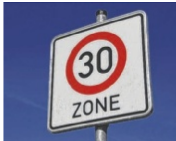
Jetzt gilt's ab 7 Uhr.

Vertreter der Eltern, der Schülerlotsen und auch der SPÖ haben sich an regionale Medien gewendet, weil sie die Sinnhaftigkeit einer 30er-Zone vor der Volksschule, die nur zwischen 10 und 20 Uhr gültig ist, kritisierten (siehe Leserbrief neben dem Artikel). Nun konnte aber eine Verbesserung erreicht werden. Das Tempolimit gilt seit vergangener Freitag an Schultagen im gesamten Bereich von Volksschule und Musikschule zwi-