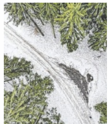
Fundort der Leiche

Gesicht und Kopf stattgefunden hat“, sagt Ulrike Breiteneder von der Staatsanwaltschaft Linz. Der Staatsanwaltschaft lag zum Tips-Redaktionsschluss am 13. Februar noch keine Aussage des Täters vor, die Tat dürfte in Zusammenhang mit einem Streit nach einem Casinobesuch stehen, bei dem der Täter viel Geld verloren hat. Die Ermittlungen laufen, dem 18-Jährigen drohen bis zu 20 Jahre Haft. Mehr lesen: www.tips.at/n/594217 ■