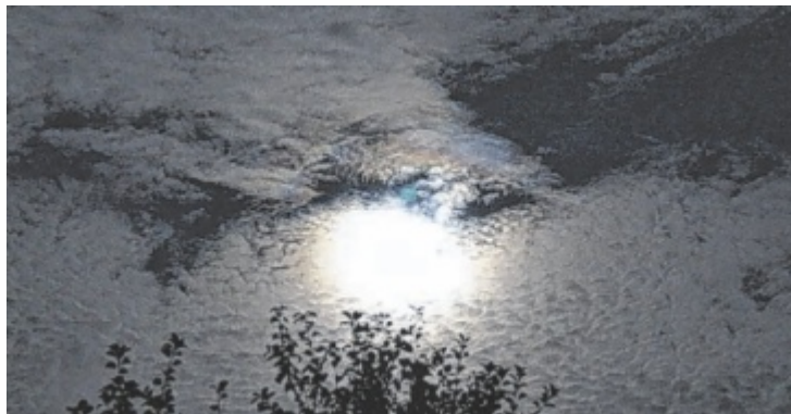
Eine Sternen- und Planetenwanderung wird in Rechberg angeboten.

Bei der kurzen Wanderung wird das Sonnensystem im Maßstab 1 zu 2 Milliarden gezeigt, dabei sind maßstabsgetreue Modelle der Sonne und der Planeten zu sehen. Auf der Karl-Weichselbaumer-Aussichtswarte werden mit einem grünen Laserpointer dann die Wintersternbilder am Nachthimmel erkundet. Die Wanderung über die Steinwiese