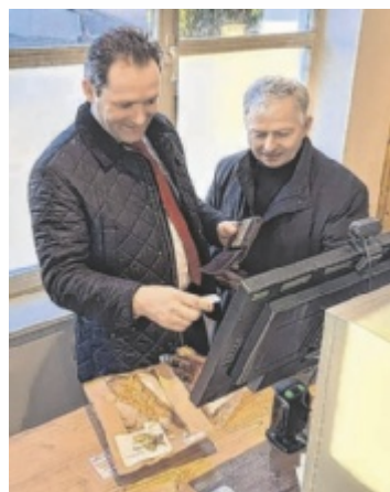
Minister bezahlt im Regionalladen.