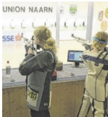
Klasse Jugend 2 weiblich

Bei den Luftgewehr-Bewerben am Samstag ging es um insgesamt 22 Bezirksmeistertitel. Der Schützenverein Pabneukirchen trainiert eine große Anzahl Kinder und Jugendliche und diese