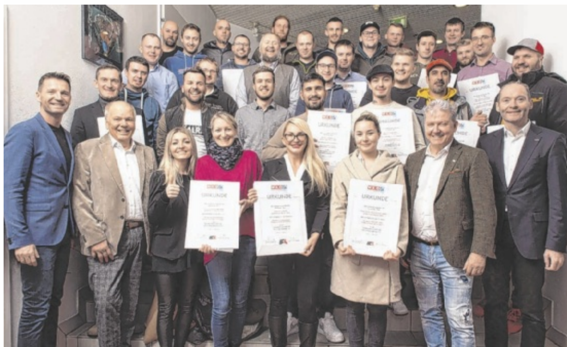
Die Absolventen des Erdbau-Lehrganges 2023