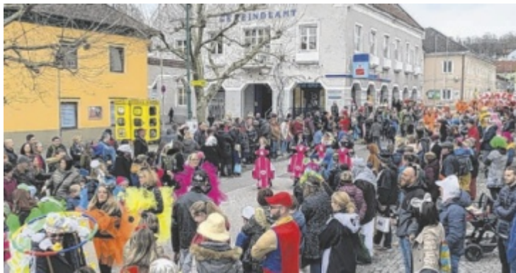
Im Schwertberger Ortszentrum sind am Faschingsdienstag die Faschingsnarren unterwegs.

Für die Funparade anmelden kann man sich unter 0676 72 42 533. ■