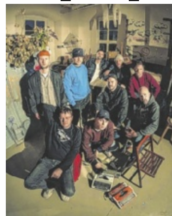
TTR Allstars, die Mannschaft von Tonträger Records, live erleben

Karten: posthof.at , Ö-Ticket. Tips verlost 4x2 Freikarten. ■