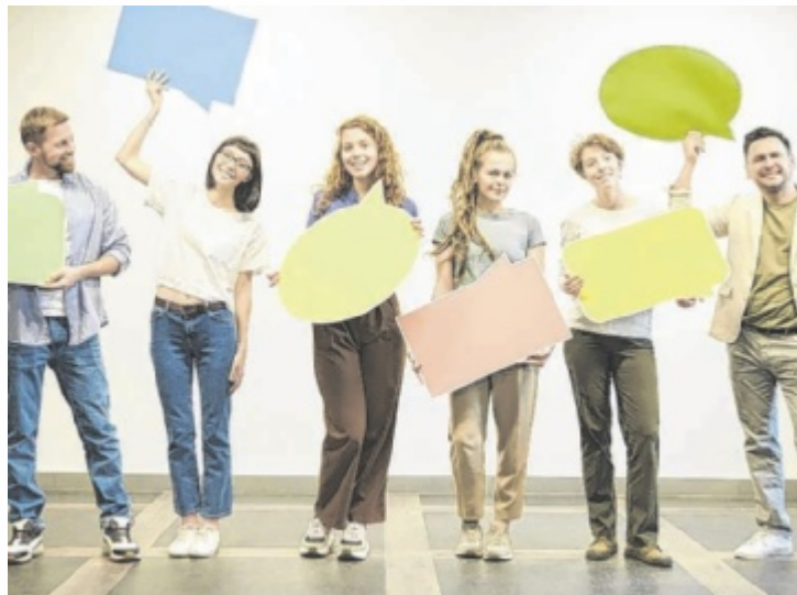
Mit anderen Menschen über ein Thema reden.

„Ziel ist es, Themen anzusprechen, die viele von uns interessieren und beschäftigen. Jede Meinung ist wertvoll und jede Meinung darf Platz haben. Mir ist es wichtig, ein Angebot zu set-