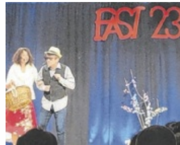
Die Sketche sorgten für fast ununterbrochenes Lachen im Publikum.

SCHWERTBERG. An den ersten beiden Februarwochenenden ging in Schwertberg erneut die Faschingssitzung der Damischen Rittersrunde über die Bühne.