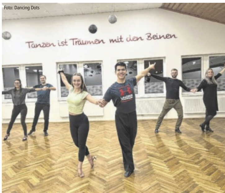
Am Freitag, 20. Jänner startet das Frühjahrstraining mit den Dancing Dots.

ST. MARTIN. Beschwingt ins neue Jahr mit den Dancing Dots: Am Freitag, 20. Jänner, um 19.30 Uhr startet das Frühjahrstraining im Klublokal in St. Martin. Perfekt für Anfängerpaaire, die in zwangloser Atmosphäre Tänze aus Standard und Latein erlernen wollen. Besonders beliebt auch bei Brautpaaren, die bei ihrer Hochzeit eine gute Figur aufs Parkett legen möchten. ■ Anzeige