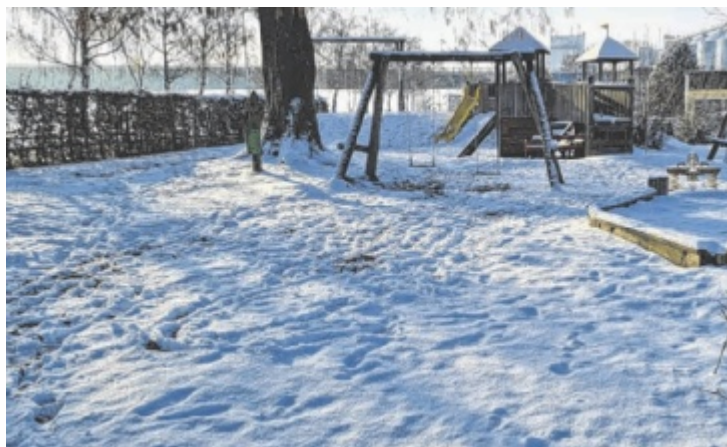
Auf diesem Spielplatz in Aschach gab es große Aufregung um herumliegende Zigarettenstummel.

Das sei auch im Zuge der Diskussion im Gemeinderat klargestellt worden. Daher habe die ÖVP selbst den Antrag insofern