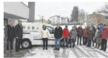
Das ganze Jahr im Einsatz für die Mitmenschen

Wurden die Menüs in der Anfangszeit noch von Wirten der vier Gemeinden zubereitet und von freiwilligen Fahrern in ihren Privat-Pkws ausgeliefert, ist seit 2016 die Küche vom Alten- und Pflegeheim Kallham dafür zuständig. Im Jahr 2020 wurde ein Lieferwagen angeschafft. Ab diesem Zeitpunkt wurden etwa 40 Menüs pro Tag, sieben Tage die Woche ausgeliefert. Seit September 2022 wird mit zwei Pkws ausgeliefert. Somit können bis zu 50 Bezieher täglich eine warme