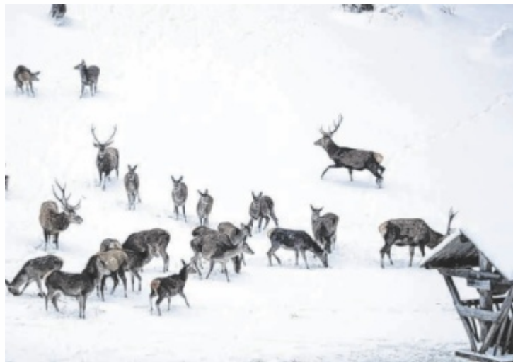
Im Winter braucht das Wild besonders viel Ruhe.

Bedenkt man die grundsätzlichen rechtlichen Grundlagen,