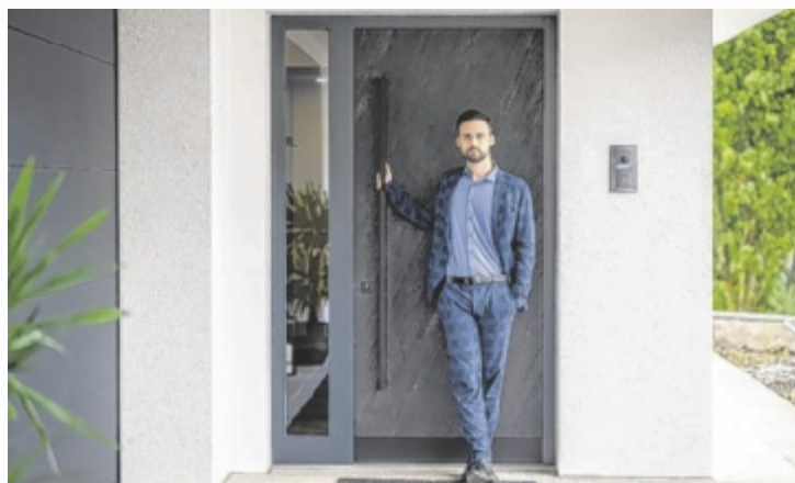
Außentüren für jeden Geschmack bei Wippro.

Die Haustüren werden auf der Innenseite tatsächlich mit der Optik der Innentüren harmonisch abgestimmt – egal ob klassisch mit Füllungen, glatt oder komplett flächenbündig mit der Wand verschmolzen. Auch Echt-Holz in den