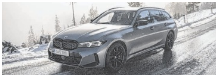
Der BMW M340i xDrive Touring ist ab 78.400 Euro erhältlich.

Hätte der 3er Touring eine Schwäche, der Bi-Turbo würde sie im Rückspiegel verschwinden lassen. Der Motor liefert ein Feuerwerk für die Sinne, ja auch optisch;