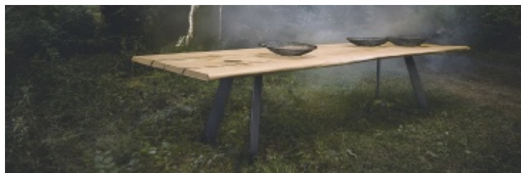
Baumtisch von der Naturfabrik jetzt zum Aktionspreis!