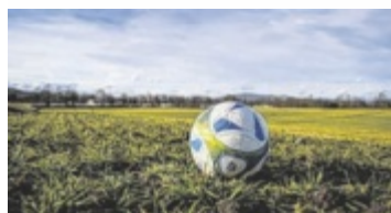
Fußballevent von 5. bis 8. Jänner 2023