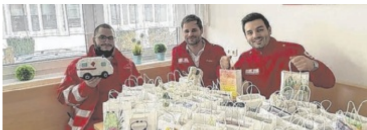
Große Freude bei den Mitarbeitern der Rotkreuz-Ortsstelle Grieskirchen