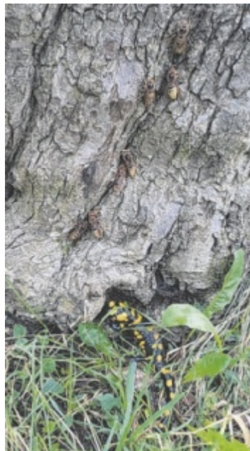
Diese spannende Zusammenkunft von einem Feuersalamander mit Hornissen fing Robert Ennsfellner in Eschenau ein.