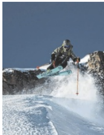
Jede Menge Spaß bei den Snow und Action Days

Die Quizgondel ist wieder dabei, zu gewinnen gibt es tolle Preise für alle, die mitmachen. Der Hauptpreis ist eine Saisonkarte für die nächste Saison. Auf den Pisten warten coole Abfahrten und jede Menge Schnee auf die Besucher. Abseits der Pisten gibt es Riesendart und viele weitere Attraktionen. Mehr dazu auf www.4youcard.at ■