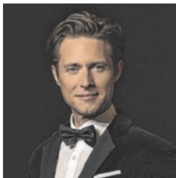
Musicalstar Lukas Perman tritt in Peuerbach auf.

In Peuerbach findet 2023 das landesweite Kulturfestival communal statt. Beim Neujahrskonzert gibt es zum Thema des Festivals „Kosmos. Neue Welten“ eine erste musikalische Einstimmung. Dazu wird neben klassischer Musik von Strauss, Mozart und Lehar Lukas