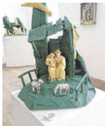
Am 6. und 8. Jänner können die Kripperl noch bestaunt werden.