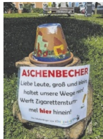
Ein von Kindern angefertigter Aschenbecher soll für Sauberkeit am Spielplatz sorgen.