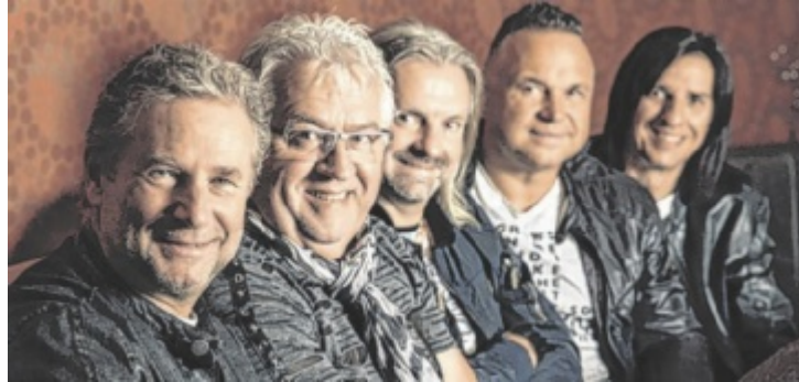
Das Nockalm Quintett kommt zum Hoamat-Open-Air.

Österreichs erfolgreichste Schlager-Kultband steht seit 40 Jahren auf den Bühnen im deutschsprachigen Europa, 2023 kommt das Nockalm Quintett auch zum Hoamat-Open-Air nach Haibach. Das Sommerkonzert komplettieren tags darauf Die Seer, die mit der Hoamat bereits eine besondere Verbindung aufgebaut haben. Zum vierten Mal können die Besucher die Musik der Seer genießen. Erklärtes Ziel der Band: Das Publikum