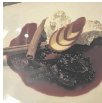
Als Dessert gibt es süße Grießnockerl.

Für das Süße lässt man Milch mit Zucker und Vanilleschote aufkochen und den Grieß einlaufen. Dann lässt man es köcheln, bis sich die Masse vom Topf löst, rührt die