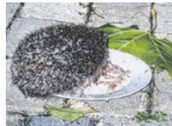
Dieser kleine Igel kommt gerne zu Gerda Kepplinger aus Eferding zum Abendessen.