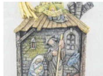
Krippen in den verschiedensten Formen sind ausgestellt.