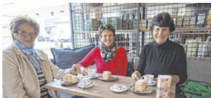
Fröhliche Gesichter bei den Sauwald-Erdäpfel-Einkaufswochen.