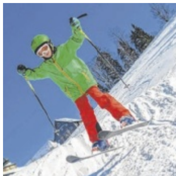
Erste Sprünge üben auf der Schanze in Hinzenbach

Erforderlich für die Teilnahme sind ein Alter von sechs bis neun Jahren sowie eine vollständige Skiausrüstung (Alpin-Ski, Skischuhe, Winterkleidung, Handschuhe, Helm). Grundkenntnisse