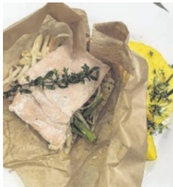
Als Hauptgang gibt es Fischfilet auf Gemüsebett.

Die Räucherlachs-pofesen kann man als Beilage in der Suppe oder wie in diesem Fall auf Salat anrichten.