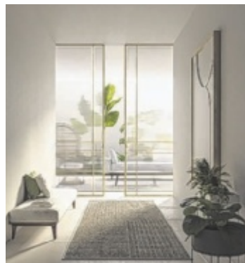
Platzwunder: Alle Modelle der Glastüren sind auch als Schiebetüren erhältlich. Am Bild: Modell Takehara

Mit extrem schlanken Rahmen von nur 15 Millimeter Ansichtsbreite aus pflegeleichtem Aluminium und verdeckten Beschlägen ohne sichtbaren Schlosskasten un-