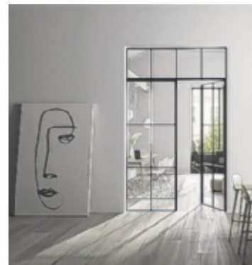
Im Modell Convent Garden unterstreichen dezente Sprossen den Industrial Look.

terstreichen diese Glastüren den Anspruch modernster Architektur. Sie sind Ausdruck der minimalistischen Designsprache von Josko. Auch sichtbare Drehbänder sucht das anspruchsvolle Auge hier vergeblich. Denn diese sind nach dem hohen Designverständnis von Josko bei seinen MET-Zargen oh-