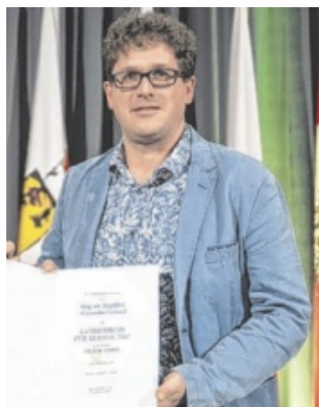
Siegfried Fruhauf wurde ausgezeichnet.