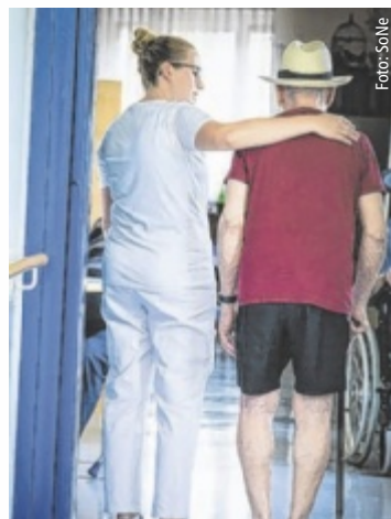
Die Arbeitsplatzsicherheit in der Region und die Vereinbarkeit von Familie und Beruf sind wesentliche Vorteile.

Beim Start der Pflegeausbildung kann ab sofort das oö. Pflegestipendium in der Höhe von 600 Euro pro Monat für die Min-