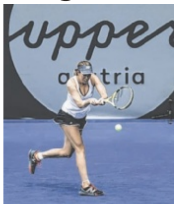
Die Tenniselite trifft sich im Februar in Linz.