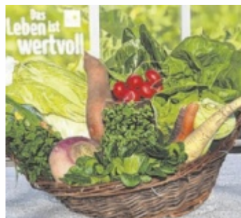
Wintergemüse aus Oberösterreich – die preiswerte Alternative für den Vitaminkick in der kalten Jahreszeit

Das Angebot reicht von Kohlgemüsen wie Kraut über diverse Salate und Wurzelgemüse-Arten bis hin zu Zwiebelgewächsen oder Fruchtgemüse wie Speisekürbis oder Zuckermais. „Durch die derzeitige Energiepreis-Kri-