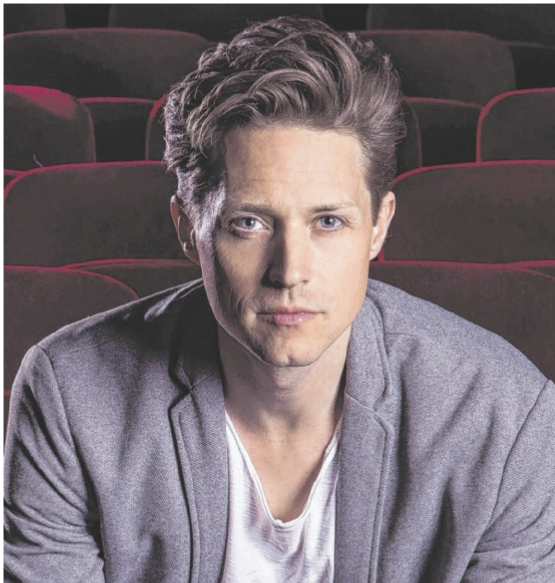
Musikalisch ins neue Jahr Gesangsstar Lukas Perman tritt beim Neujahrskonzert in der Sternengaststätte Peuerbach auf und wird die Besucher in die Welt der Musicals entführen. Seite 36