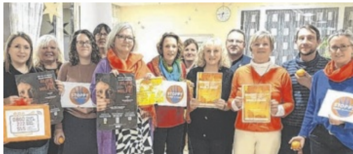
Aktion im Zuge der UN Kampagne „Orange the World“

Dieser Zeitraum wird weltweit genutzt, um Gewalt gegen Frauen zu thematisieren. Seit 1991 macht die UN-Kampagne „Orange the World“ auf Gewalt