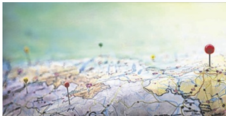
Die Reisebranche ist für Jugendliche attraktiv.