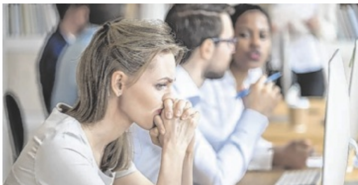
Während Corona ist die Zahl der psychisch stark belasteten jungen Menschen stark gestiegen. Auch die Zufriedenheit im Job ist gesunken.