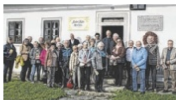
Vor dem Stifter-Geburtshaus in Oberplan