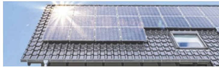
Photovoltaik-Anlagen werden immer beliebter.

waren es knapp 9.000. Von 1. Jänner bis 30. September 2022 wurden von den Mitarbeitenden der Netz Oberösterreich rund 18.000 Anträge bearbeitet. „Das seien in neun Monaten deutlich mehr bearbeitete Anträge als in den 24 Monaten zuvor, erklärt Netz OÖ. „Zudem warten weitere rund 6.000 Anträge noch auf Bearbeitung. Wir gehen davon aus, dass sich die Gesamtzahl bis zum Jahresende auf weit über 30.000 Anträge und die Zahl der bearbeiteten auf weit mehr als 25.000 Anträge erhöhen wird“, so das Energie-Unternehmen. Weiters heißt es von Netz OÖ, dass man immer nach der Prämisse handle, dass die zuverlässige Versorgung aller Kunden mit