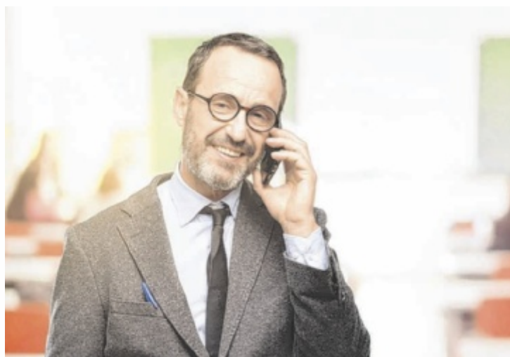
Raus aus dem Klassenzimmer, rein ins Büro

Viele Lehrkräfte wünschen sich zudem Möglichkeiten, ihre Perspektive außerhalb der Schule zu erweitern, um frische Ansätze in den Unterricht und die Schule zu bringen. Das Projekt Seitenwechsel hat das Ziel, Wissenstransfer in beide Richtungen zu ermöglichen. „Wir wollen durch das Projekt mehr Durchlässigkeit zwischen Schule und Wirtschaft