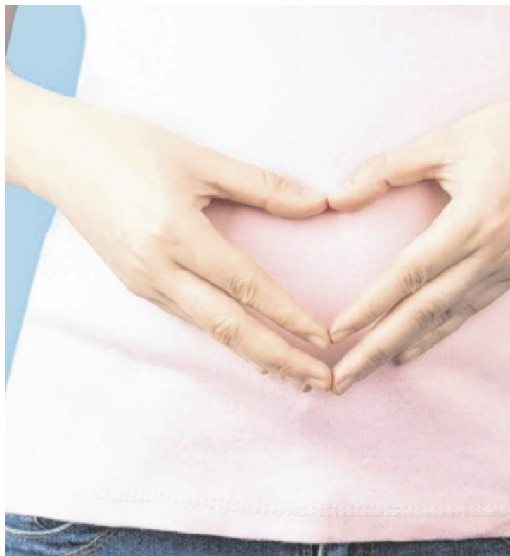
Der Darm spielt bei vielen Gesundheitsthemen eine große Rolle.

Natürlich macht es Sinn, den Darm schon frühzeitig zu unterstützen, da er ganz vereinfacht gesagt eine Art von „Geheimwaffe“ für viele Dinge ist. Angefangen bei der Wunschfigur, über den unerfüllten Kinderwunsch bis hin zu Hautthematiken. Altersbedingte Erkrankungen, wie