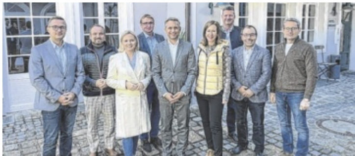
Landesrat Wolfgang Hattmannsdorfer beim Austausch mit den Eferdinger ÖVP-Funktionären

Eine der zentralen Herausforderungen der nächsten Jahre ist das Thema Pflege. Von den geplanten Änderungen im Bereich der Pflegeausbildung, allen voran vom OÖ Pflegestipendium, berichtete Sozial-Landesrat Hattmannsdorfer beim ÖVP-Funktionärsaustausch. Mit der Pflegelehre hat man eine neuartige Form der Ausbildung in der Pflege geschaffen. Der Lehrberuf wird vorerst pilotmäßig im