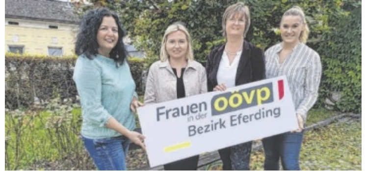
Die ÖVP-Frauen thematisieren das Thema Krebsvorsorge.

Es gibt Krebsarten, gegen die es eine Impfung gibt: Gebärmutterhals- und Rachenkarzinome können durch eine zeitgerechte Impfung vermieden werden.