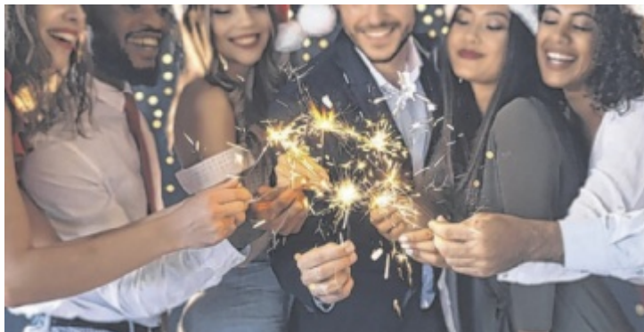
Die Zeit der Weihnachtsfeiern naht.

Die einen freuen sich auf Punsch mit Kollegen, den anderen stehen beim Gedanken die Haare zu Berge, kostbare Freizeit mit Leuten aus der Firma verbringen zu müssen. Ob die Weihnachtsfeier „Privatvergnügen“ oder Arbeitszeit ist, kommt auf den Einzelfall an.