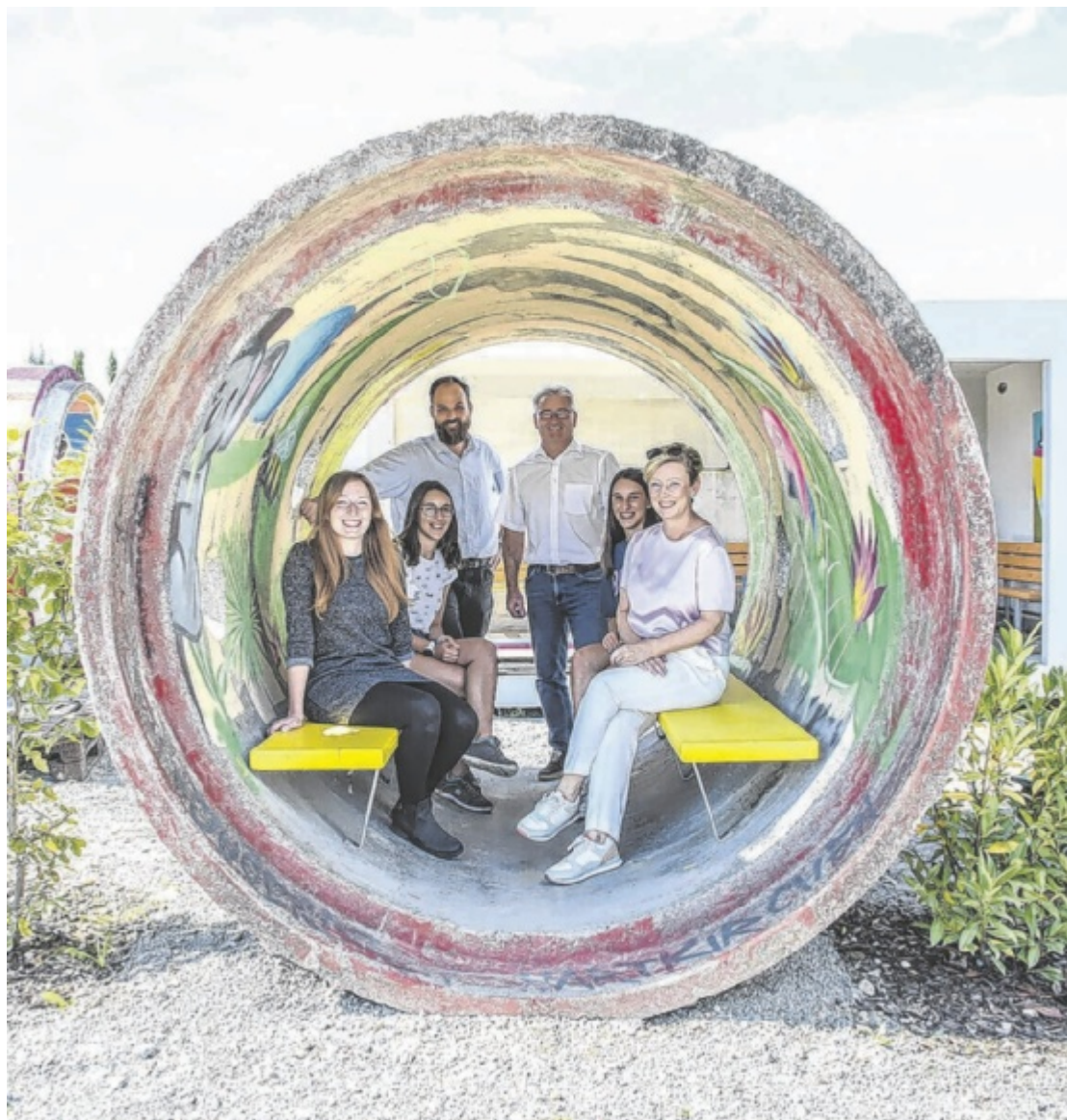
Projekt 21 Der Jugendtreff in Hartkirchen wird vom Projekt-21 gefördert. Dieses geht nun in die nächste Runde. Dabei werden zahlreiche gemeinnützige Projekte von der Sparkasse unterstützt. Seite 10 / Foto: Sparkasse Eferding-Peuerbach-Waizenkirchen