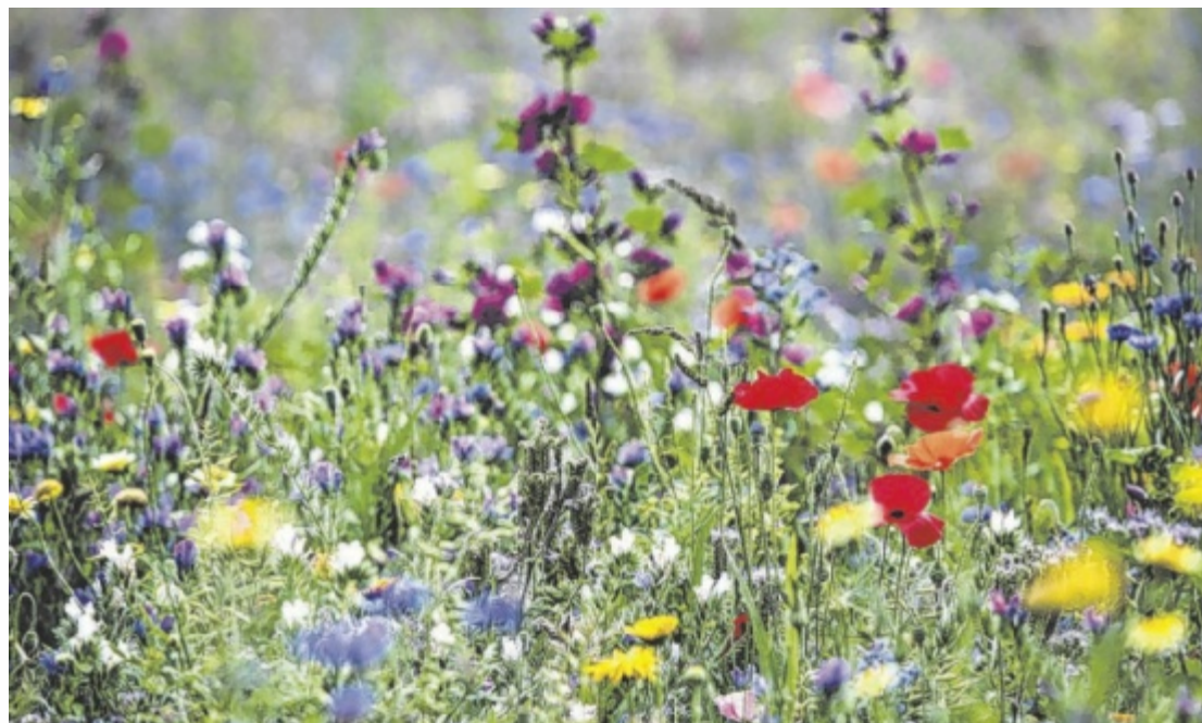
Selten ist die Artenvielfalt auf heimischen Wiesen so groß wie auf diesem Foto.

Blühendes Österreich stellt 300.000 Euro für Biodiversitätsprojekte zur Verfügung, die im