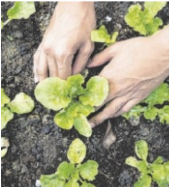
In 266 Betrieben im Bezirk Eferding werden Gemüse, Obst und Getreide produziert.

Über 821 landwirtschaftliche Betriebe mit einer Fläche von insgesamt 24.948 Hektar verfügt der Bezirk Eferding. Gegenüber 2010 gab es somit einen Zuwachs in den verfügbaren Agrarflächen um 22,5 Prozent, bei den Bioflächen um 27,3 Prozent. 266 Betriebe haben sich auf den Anbau von Nahrungsmitteln (Gemüse, Obst, Getreide) spezialisiert. Weiters gibt es 228 Betriebe mit Futtermittel-Anbau und 123 Forstbetriebe. In der Tierhaltung dominieren im Be-