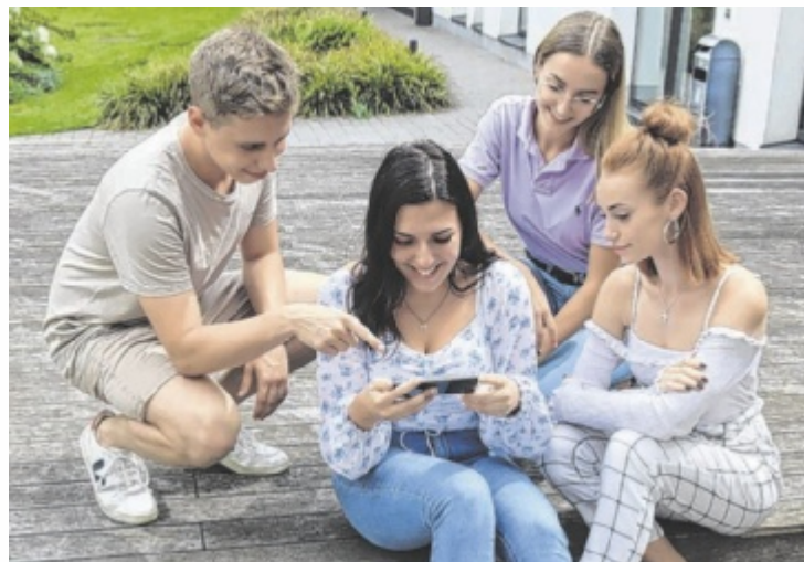
In drei unterschiedlichen Kategorien können Projekte eingereicht werden.