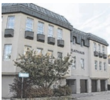
Im Aschacher Rathaus lehnten SPÖ und Grüne einen FPÖ-Antrag zur Verwendung von Impfkampagnen-Geld ab.

Die Teuerungskrise ist allgegenwärtig, zuletzt stieg die Inflation bereits auf über 10 Prozent. Die FPÖ Aschach forderte daher, dass die Gemeinde Aschach das Impfkampagnen-Geld (rund 17.000 Euro) des Bundes für Anti-Teuerungsmaßnahmen verwendet, sobald die Zweckwidmung von zuständiger Stelle aufgehoben werden sollte. „Auf diese Weise würde das Gemeindebudget nicht zu-