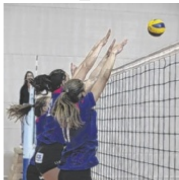
Geballter Einsatz gegen die ASKÖ Pregarten

Deutlich machten es auch die Herren vom UVB Sparkasse Grieskirchen: Sie spielten bei der