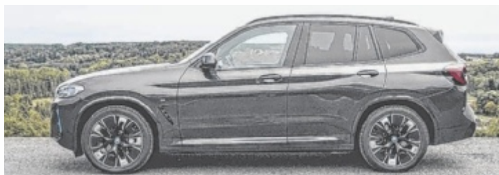
Der BMW iX3 Impressive ist ab 75.188 Euro erhältlich.

Keine 18 Monate nach Marktstart ein Update zu lancieren – wie das BMW jetzt beim iX3 macht – ist definitiv mal was ganz anderes. Vielleicht ist hier dann auch der richtige Zeitpunkt für eine Entwarnung, denn wirklich was passiert, ist letztlich eh nicht. Ein paar neue Lidstriche bei den LED-Signaturen und einige wenige zusätzliche blaue Akzente betreffen das Exterieur. Im Interieur ist ab sofort das BMW Live Cockpit mit 12,3 Zoll großem Instrumentendisplay serienmäßig, eine induktive Ladeschale und die Möglichkeit für over-the-air Updates fanden ebenfalls Einzug.