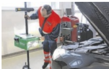
Es ist wichtig, dass die Scheinwerfer richtig eingestellt sind.