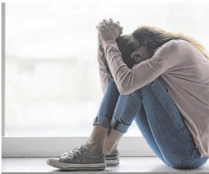
Die psychische Gesundheit von Jugendlichen bekommt seit der Corona-Pandemie langsam mehr Stellenwert.

Eine Studie der Donau-Universität Krems von Dezember 2021 bestätigt den besorgniserregenden Trend bei jungen Menschen: Depressive Symptome, Angstsymptome, aber auch Schlafstörungen haben sich seit Beginn der Corona-Pandemie verfünf- bis verzehnfacht. Heuer setzen die Österreichischen Jugendinfos daher einen Fokus auf das Thema „Mentale Gesundheit“. Mit 10. Oktober, dem Welttag der psychischen Gesundheit, starteten die Österreichischen Jugendinfos