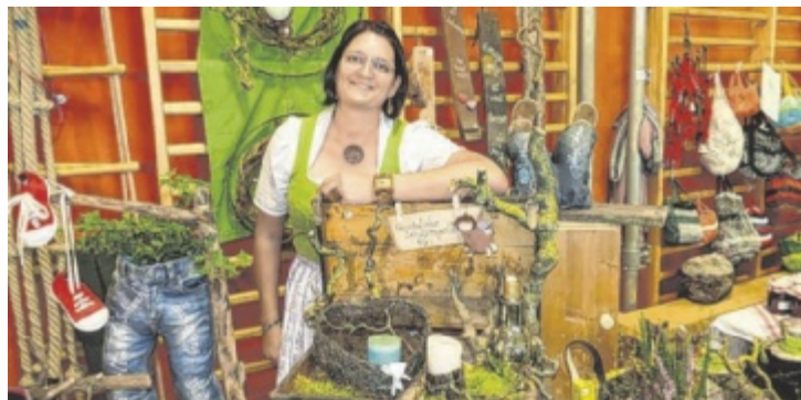
Der Hofkirchner Martinimarkt besticht durch Kunsthandwerk.

Über 70 Aussteller präsentieren in der Aula und in den Turnsälen der Mittelschule wieder ihre Handwerkskünste. Glaskunst, Keramik, Klosterarbeiten, Krippen, Blumen und vieles mehr gibt