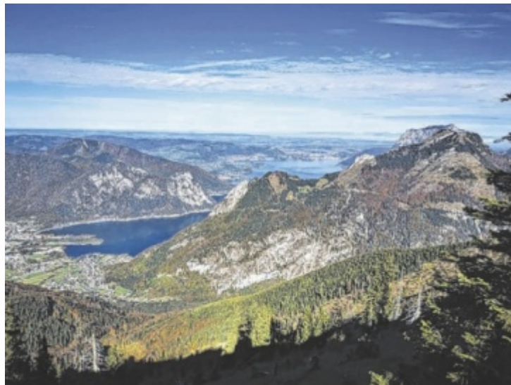
Traumhafter Blick vom Grat auf den Traunstein

Die Anreise erfolgt mit dem Zug nach Ebensee Landungsbrücke oder Steinkogel. Von dort fährt das Traunseintaxi (unbedingt