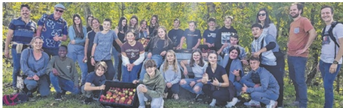
Die Schüler der Mittelschule St. Agatha freuten sich über ihre Gäste aus anderen Ländern.

Unter dem Motto „Get fit for a greener world“ wurden zahlreiche Aktivitäten im Hinblick auf