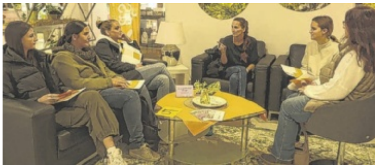
Junge Menschen informierten sich beim Assista-Begegnungstag über Sozialberufe.