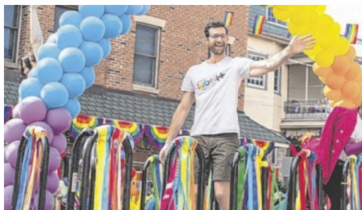
Billy Eichner hat das Drehbuch geschrieben und spielt Bobby.