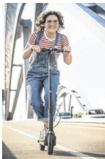
Mobil ans Ziel mit dem Scooter

Bei der Verkehrserhebung 2022 wird darüber hinaus erstmals ein