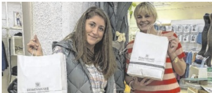
Eva Maria Marold (l.) kleidete sich nach ihrem Auftritt beim Musiksommer in der Boutique Hohensinner in Bad Schallerbach neu ein.

Beim Musiksommer-Auftritt begeisterte Kabarettistin Eva Maria Marold mit ihrem Programm „Vielseitig desinteressiert“ die Besucher in Bad Schallerbach. Dabei überraschte die Künstlerin wieder einmal mit ihrer Vielseitigkeit. Die gebürtige Burgenländerin, eine geborene Sängerin, entführte gebührend in die Welt, in der sie sich geborgen fühlt: die Welt der Musik. Wie von Eva Maria gewohnt, war es ein sehr persönlicher Abend mit ihren ur-eigensten Interpretationen bekannter Lieder von A wie ABBA bis zu Z wie ZAPPA. An-