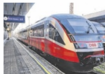
Sonderzug der Almtalbahn

und waren bequem und klimaschonend mit dem gratis Shuttle auf der Almtalbahn unterwegs. Ein vom Verkehrsverbund in Kooperation mit der Wirtschaftskammer eigens eingerichteter, kostenloser Zugshuttle auf der Almtalbahn brachte die Messebesucher vom Hauptbahnhof Wels direkt an ihr Ziel. ■